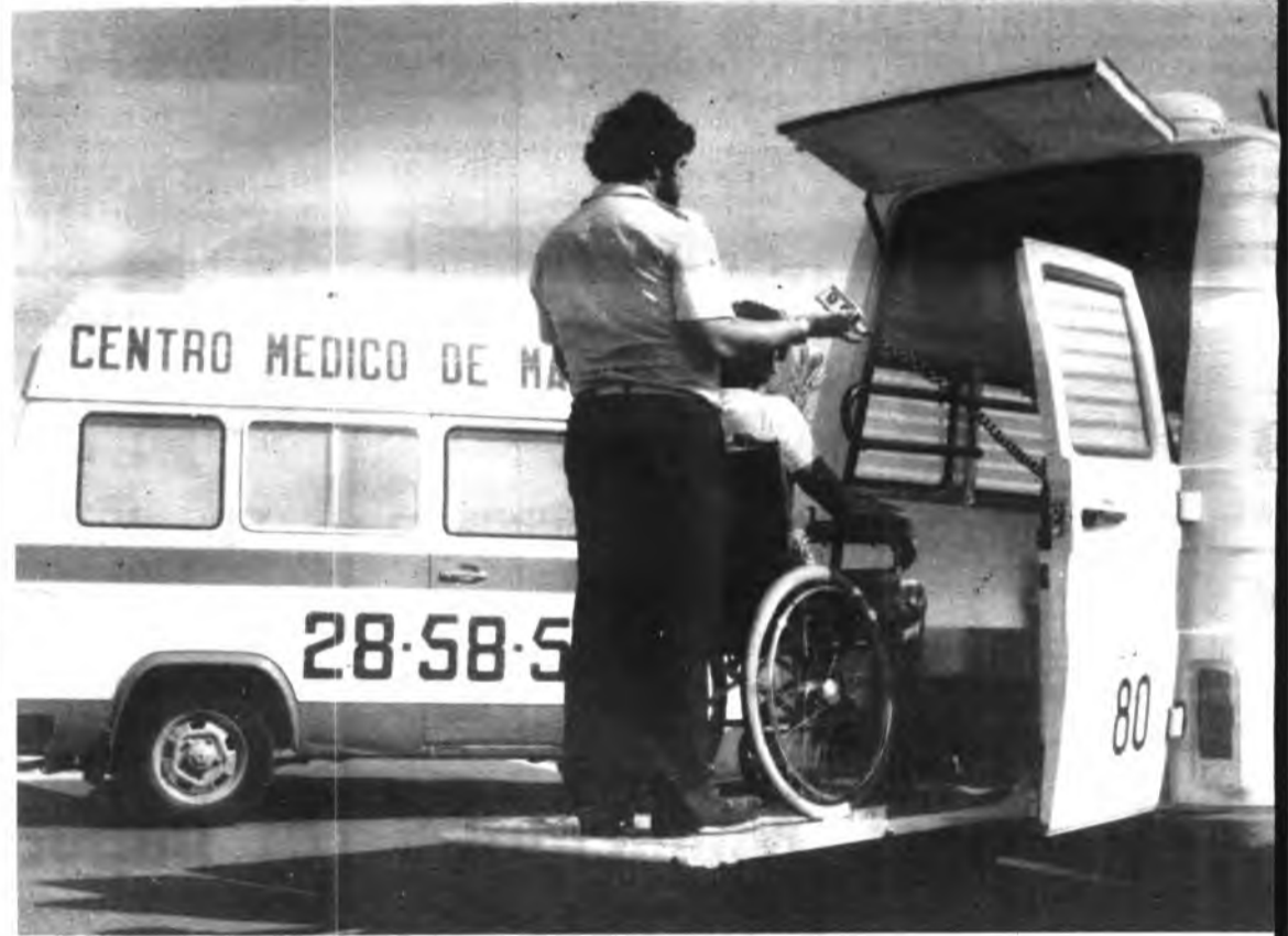
Centro Médico dice que cubre el servicio extraordinariamente. En cambio los taxistas se quejan de competencia.