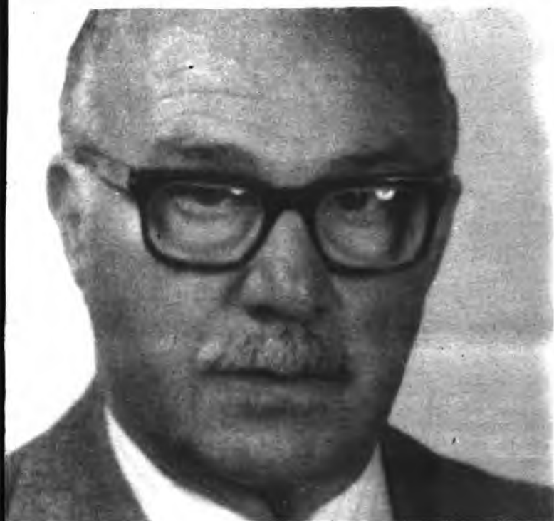
Llopart, acusado de electoralismo.