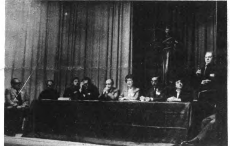
La Presidenta en el acto de la Clausura.