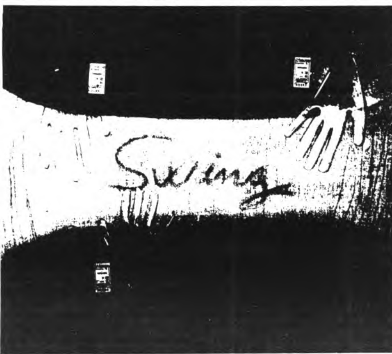
nacor i Calvia, per arribara Selva, on estarà oberta al públic fins a mitjan mes de desembre. Amer

Aquesta exposició de E. Olondriz i K. Bonnin ha viatjat durant aquests darrers mesos per Sa Pobla, Felanitx, Ma-