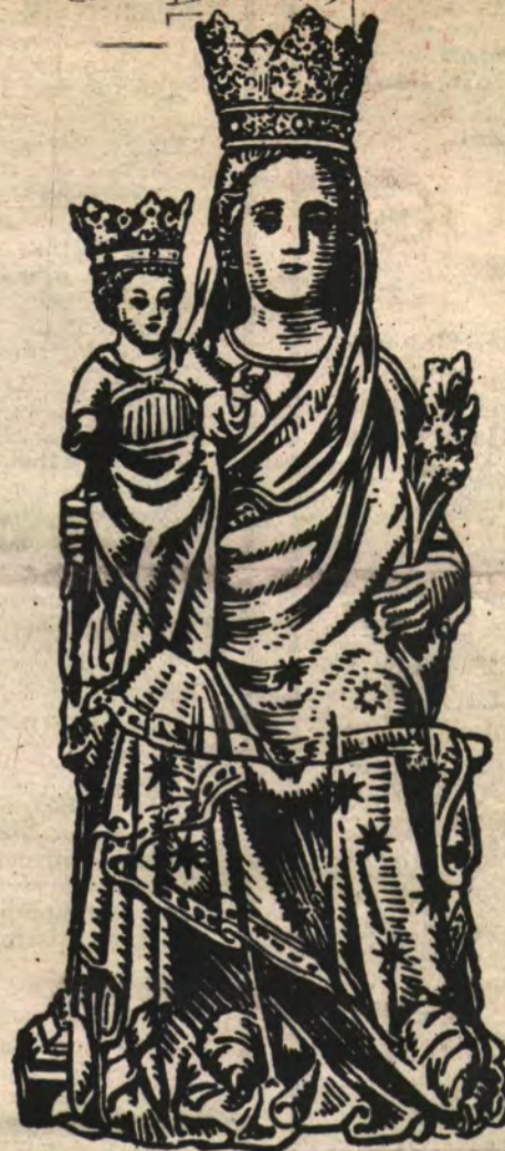
SANTA MARIA LA MAYOR