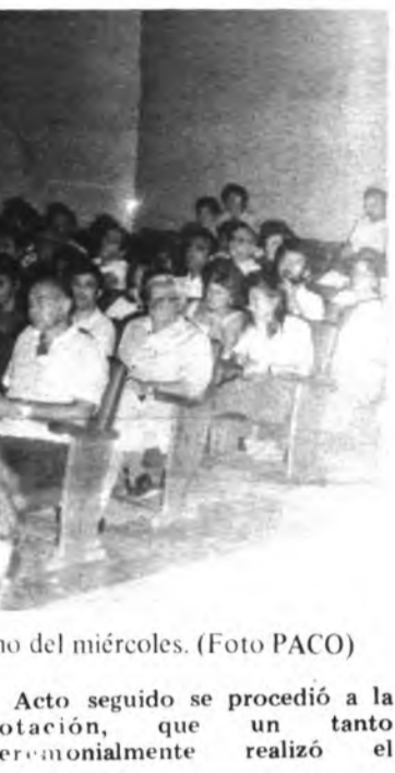
Acto seguido se procedió a la votación, que un tanto ceremonionalmente realizó el