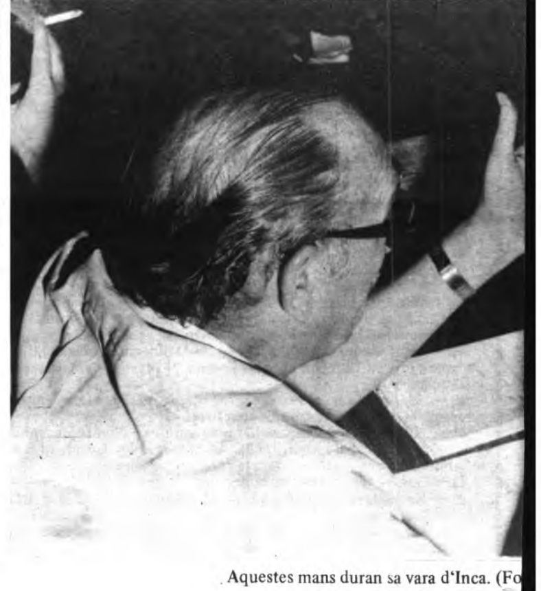
Aquestes mans duran sa vara d'Inca.