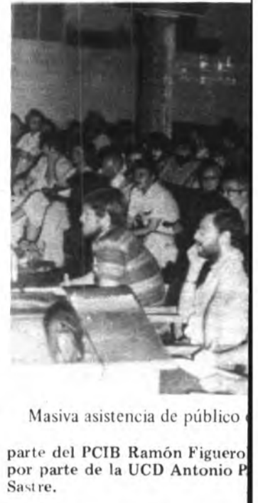
Masiva asistencia de público no del miércoles.