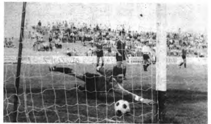
Conseguirá la delantera blanca batir la meta contraria? .