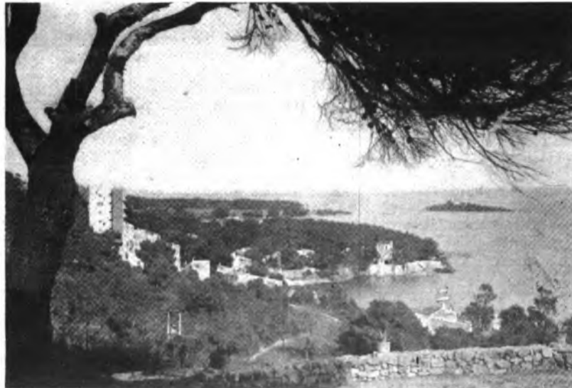
Alcanada, tema de la exposición alcuadiense.

El pasado día 15 fue clausurada en la sala de exposiciones de "La Caixa" de Alcudia, la muestra de pintura que había sido organizada por el Ayuntamiento de la ciudad de las murallas. Bajo el nombre de 5 pintores de Alcanada.