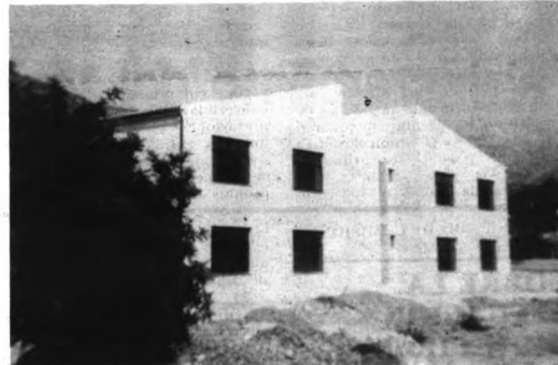
Detalle del nuevo centro escolar.

La obra se ha podido realizar gracias a la colaboración del Ministerio de Educación. El Ayuntamiento recibió las dependencias el pasado día 15 de septiembre. El Centro está situado a la entrada de la villa desde su