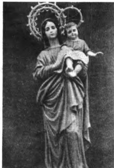
Imager de Santa María de l'Unió.

Anualmente son muchos los inqueses que acuden a su cita. Cosa que aprovechan muchas familias inqueses para pasar una jornada de esparcimiento y hermandad.