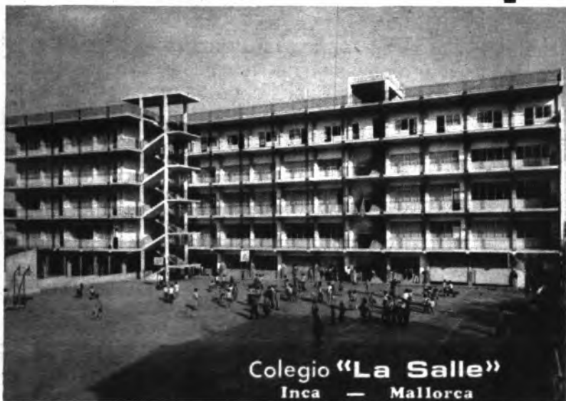
Colegio "La Salle" Inca - Mallorca