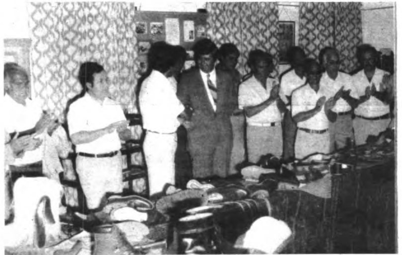
El Conseller de Industria es felicitado tras la presentación del libro "Los Zapateros de Lloseta".

Y por último un tema desde hace años polémico y de actualidad: la compra del Palacio de Ayamans. Sobre este tema quedó acordado la creación de una comisión formada por miembros del consistorio y vecinos de la villa para que estudien y gestionen la negociación con el intento de adquirir para la población el Palacio de Ayamans.