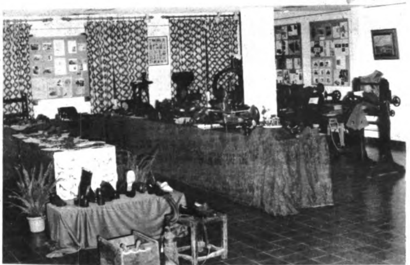
Vista parcial de la Exposición de Calzado.

Teniendo en cuenta del éxito alcanzado por la misma y de lo que en sí representa para Lloseta esta actividad, no podemos dejar de que ilustren una de nuestras crónicas.