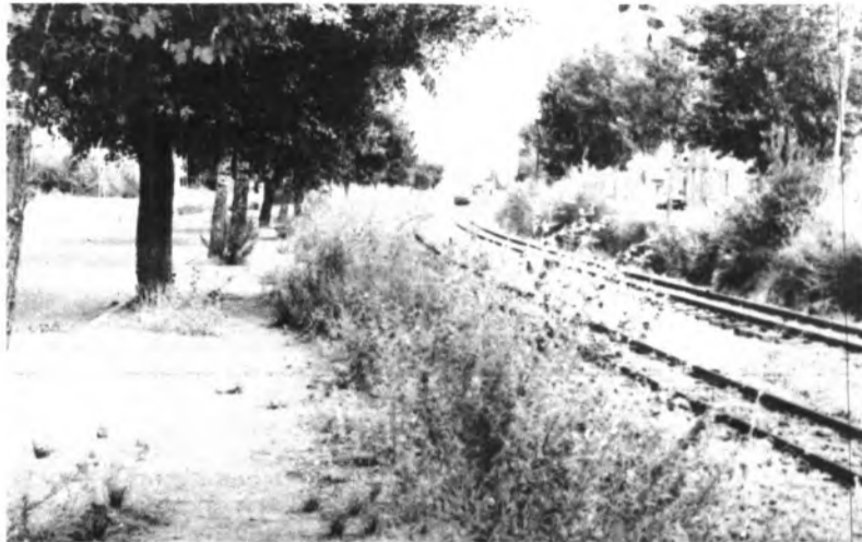
Detrás de las hierbas se tiran los trastos viejos.

Esperamos que con un poco de voluntad por parte de los responsables se solucione este problema, y más ahora que se está trabajando en la construcción de la nueva vía para el enlace con Ciutat. Pero también hay que pedir la colaboración de los ciudadanos,