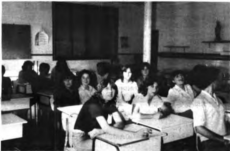
La charla y camaradería han sido siempre importantes.

Según Orden Ministerial del 14 de febrero de 1974, se hizo posible la puesta en marcha de la Educación Permanente de Adultos, prevista en los artículos 12 y 44-45 de la Ley General de Educación.