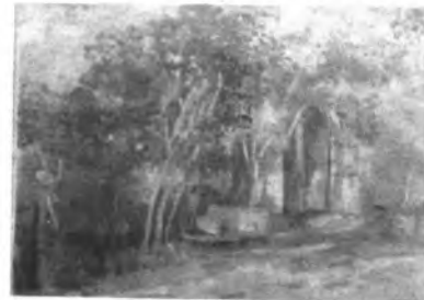
Paisaje de Catalina Salas