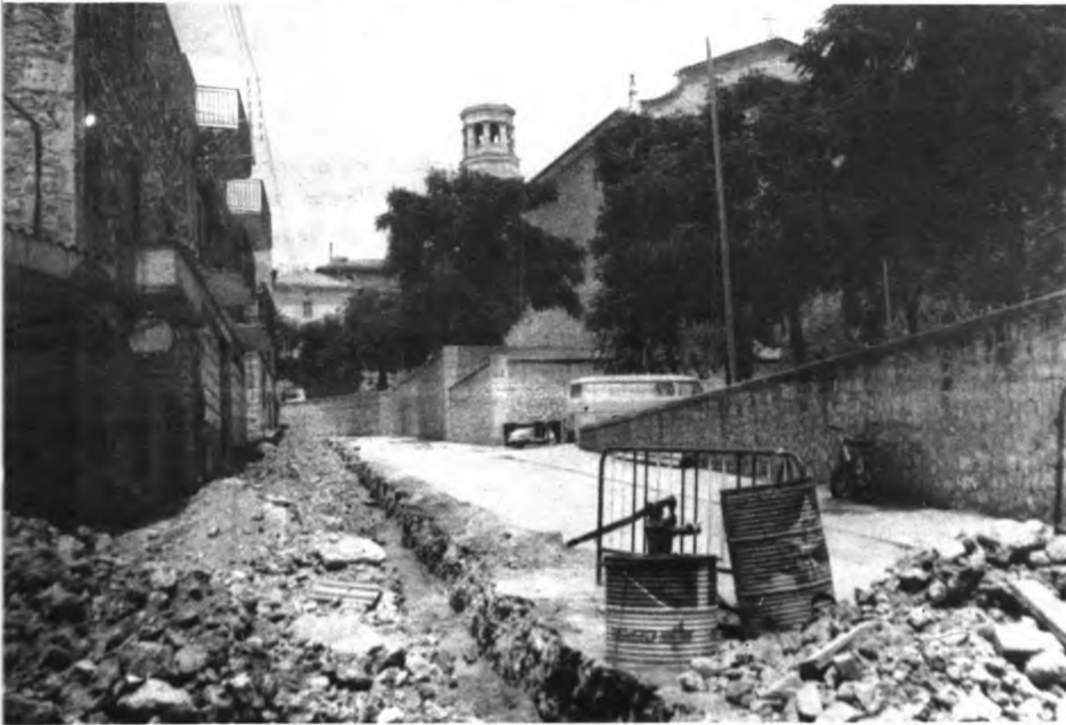
Dos calles de Lloseta abiertas por las zanjas