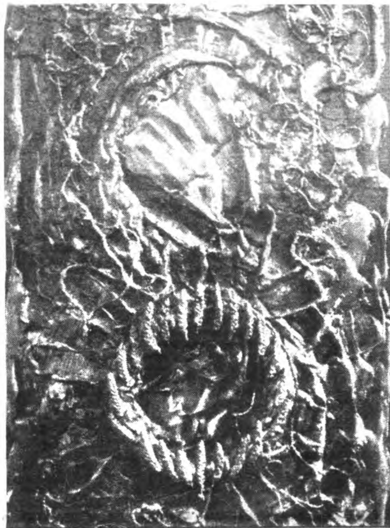
De l'obra «Col·lecció Catalunya», de l'artista Valerià Pinell, oferim el plafó «Als màrtirs de la Senyera»

LA MISMA. ESTA VALORADA EN MAS DE TRESCIENTOS MILLONES DE PESETAS