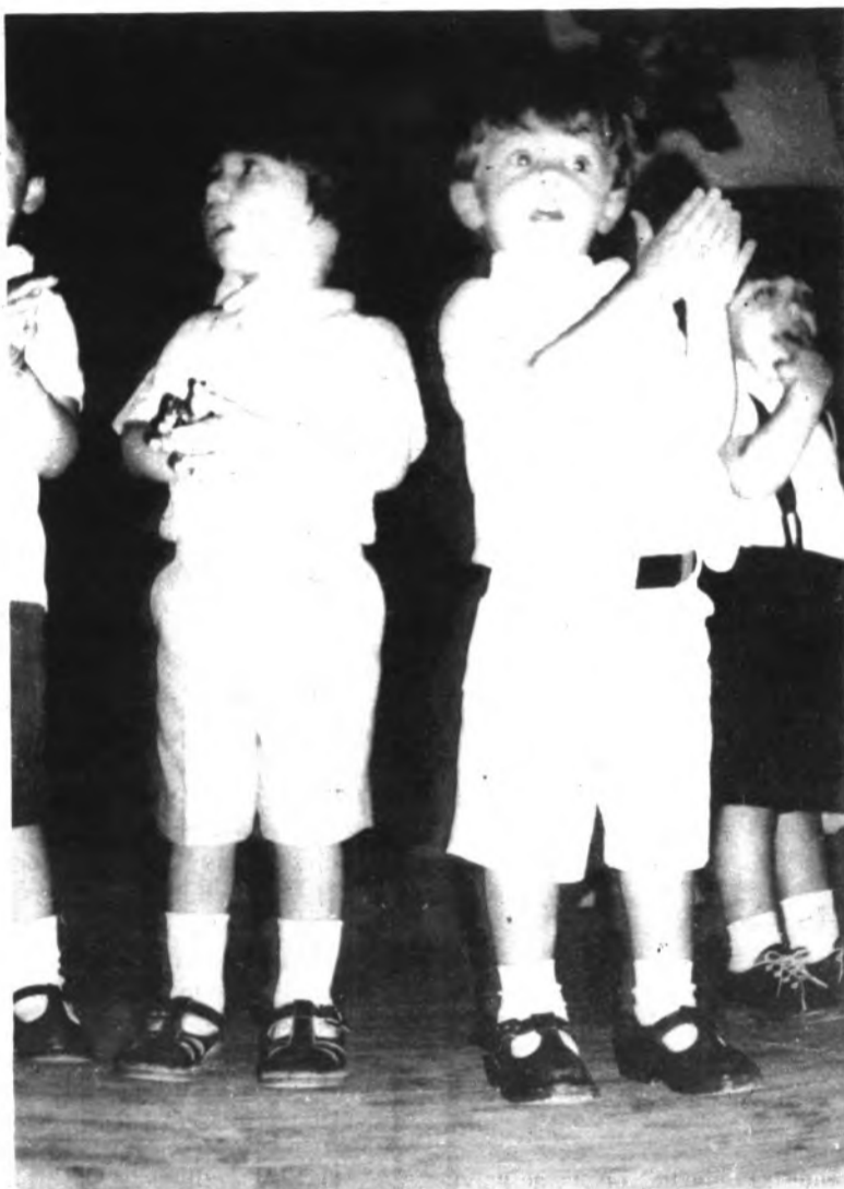
La espontaneidad y la gracia de los más pequeños destacó en la fiesta de fin de curso del colegio "San Francisco de Asís".

Aunque no abundan en estos tiempos estas fiestas siempre son