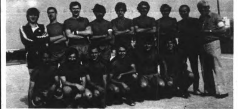
EQUIPO AFICIONADOS DEL SALLISTA.

El equipo de Segunda Regional del Juv. Sallista, después de una campaña erizada de resultados positivos, consiguió con todos los honores y merecimientos el ascenso a la Primera Regional, logrando de esta forma el objetivo marcado en el principio de temporada.