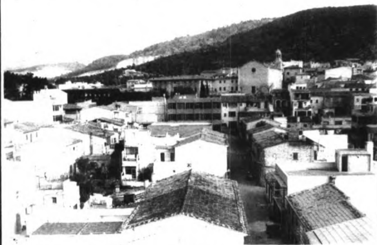
Panorámica del centro de Lloseta. Puede verse los jardines y palacio de "Ayamans" adosados al templo parroquial.

Según informaciones que hemos podido recoger de fuentes bien informadas, durante varios de los próximos meses el Palacio de los Condes de Ayamans propiedad de la entidad "Lloseta, S.A." de capital catalán se convertirá en sala de exposición y venta de obras y objetos de arte.