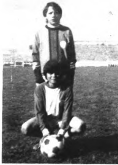
lanzamiento de penaltys.

Este torneo va a dar comienzo el próximo domingo por la mañana inicialmente se van a enfrentar el Juventud Deportiva Inca y At-Inca. Finalizado el mismo se disputará el otro partido Poblense-Cide. Mientras en la primera eliminatoria parece que el equipo organizador del torneo pasará a la final, en el segundo torneo es donde habrá mayor emoción debido a la igualdad. El sábado, día 27, se va a disputar primeramente la gran final entre los equipos perdedores de la primera eliminatoria, para luego jugar la gran final entre los equipos vencedores. Caso de finalizar algún partido con empate habrá prórroga en la final de 10 minutos cada parte, pero en los partidos de la primera eliminatoria habrá