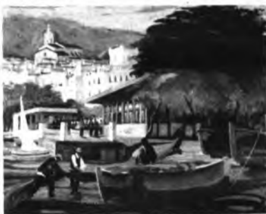
Paisaje de Reche.