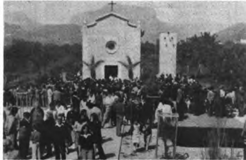
El oratorio del Cocó el día de la Romería.

el Cocó la tradicional romería del mismo nombre.