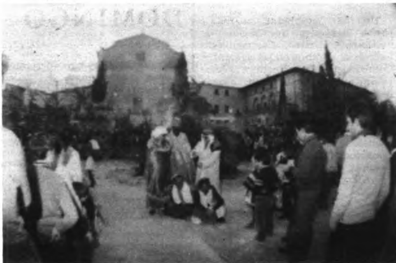
La festa de l'any passat que obtingué un bon exit.

festa de carnaval que tant d'exit obtingué l'any passat.