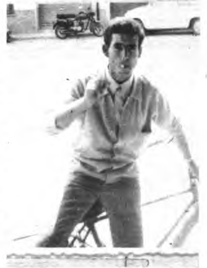
RODA, DEL CLUB PETANCA

No les acompañó la diosa suerte a los jugadores del equipo de