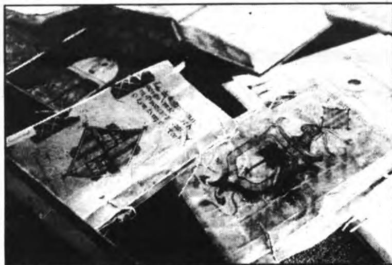
S'exhibeixen més de quaranta documents relatius a esdeveniments importants de la nostra història.

El balanç global del gran període històric en el qual les Illes Balears varen ésser governades pel Gran i General Consell, denota un passat pleteric de grandesa i magnificència, altament positiu. Amb tota justícia, avui, des de la nostra perspectiva històrica hem de concloure que aquells homes que integraren el Gran i General Consell actuaren amb bon ofici de govern, estructuraren un Regne amb un sentit de grandesa del qual en donen testimoni encara avui obres magnes com la Catedral de Mallorca, el Palau de l'Almudaina, el Castell de Bellver, el Palau de Perpinyà, Sa Llonja o el