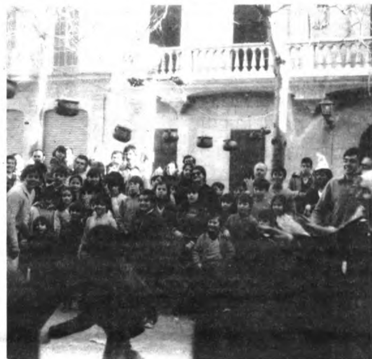
LOS NIÑOS FUERON LOS PROTAGONISTAS DE LA 1ª FIESTA INFANTIL EN NUESTRA CIUDAD

Para el domingo día 22 se está proyectando una excursión a Valldemossa y al Castillo de Bellver.