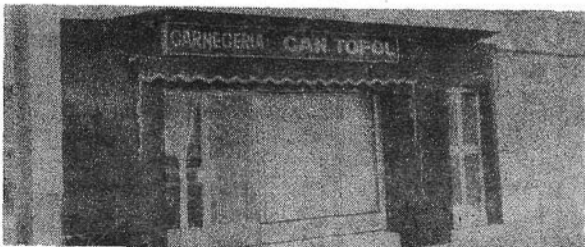
C/. Doctor Morey, 16. Telf. 622009. - CONSELL