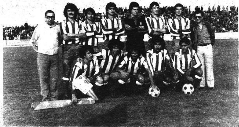
FORMACION DEL ATL MADRID, QUE SE ENFRENTO AL CONSTANCIA: (FOTO: TOMAS MONSERRAT)