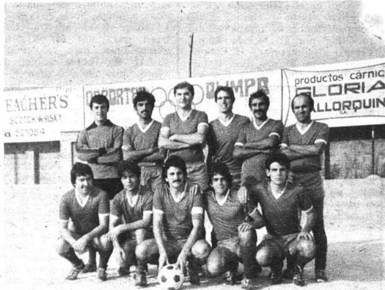
SALLISTA, 2a REGIONAL