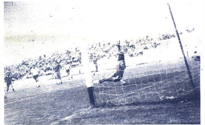
PRIMER GOL DEL CONSTANCIA, OBRA DE GUAL