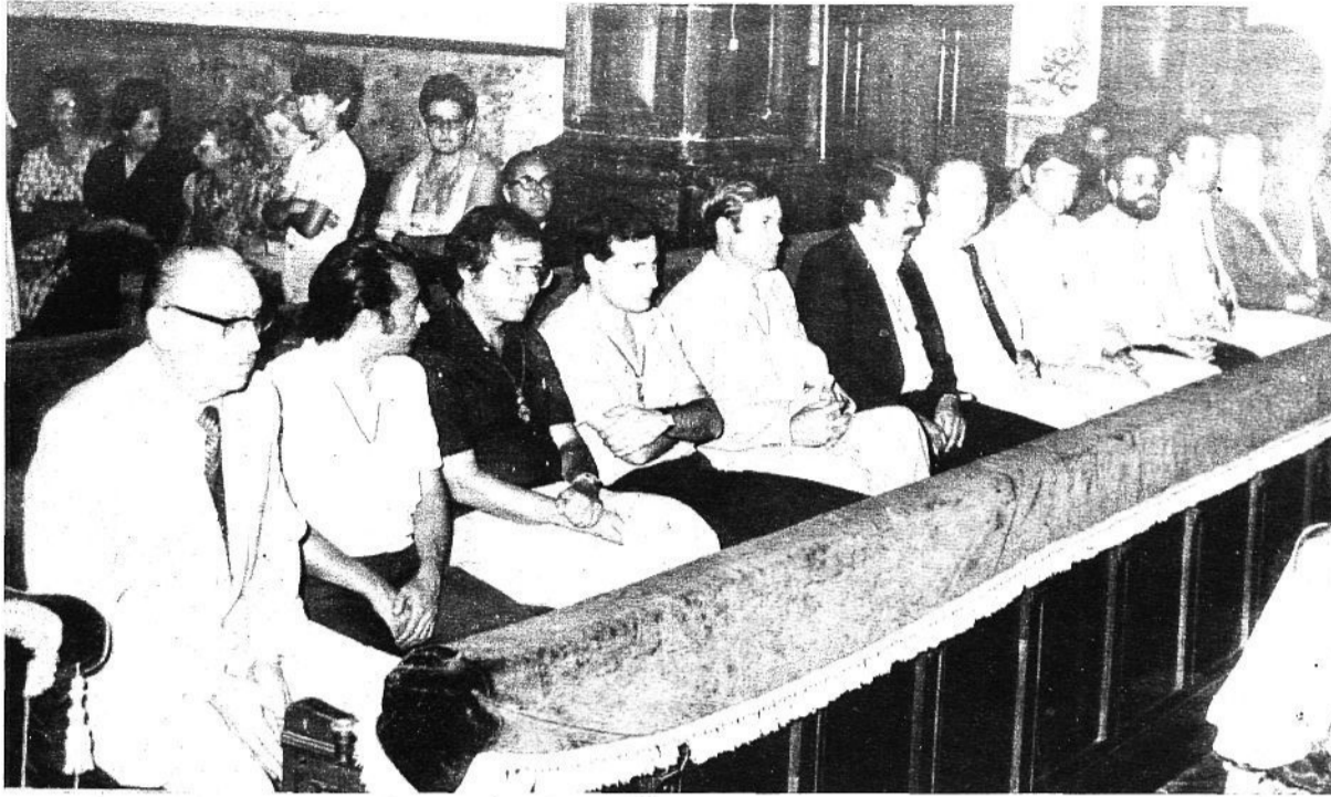
Miembros del Consistorio, en la ceremonia religiosa