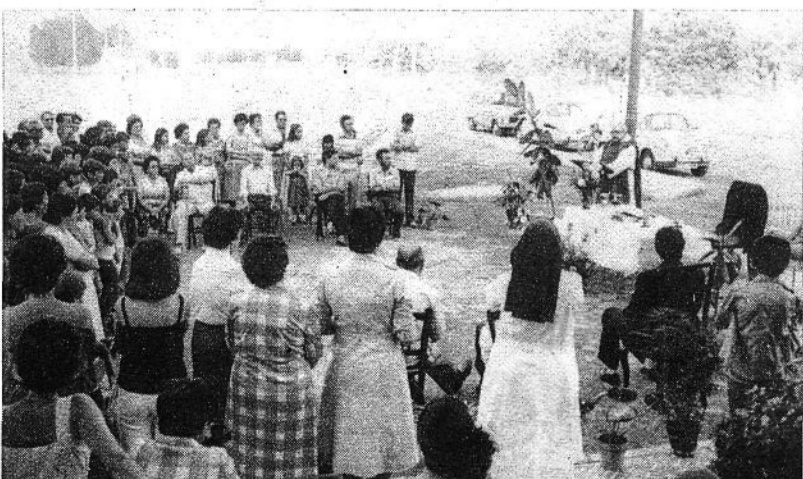
Detalle de la misa celebrada en las Viviendas "San Abdón"