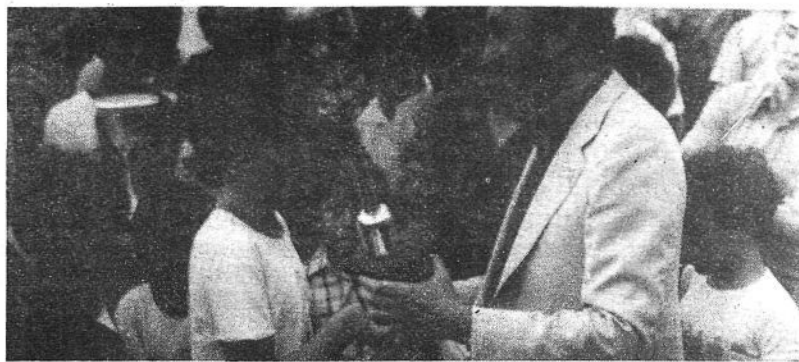
El Trofeo "Semenario DIJOURS" para el organizador del mismo: El Beato Ramón Llull. Un digno vencedor para, por lo que la experiencia ha demostrado, un digno Torneo.

Los trofeos, fueron donados por las siguientes casas. Ayuntamiento de Inca, La Caixa, Pinturas D'or - 4, Joyeria Bonnin, gran trofeo a Castura, de gran valor y belleza, Foto Sampol, C. San Miguel, Armeria Aloy, Pienso Truyols, Pienso Nanta, Deportes Olimpo, Carpinteria Inca, Almacenes Cañellas, Bar C'as Poble, Joyeria Internacional, Muebles Cerdá y Pienso Jaime Nicolau.