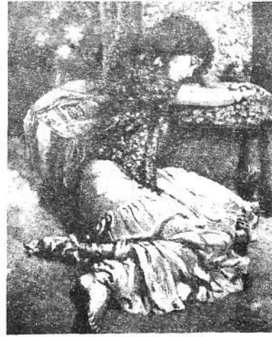
Dibujo de R. Cortiella.

En la obra de Cortiella hay composiciones de figura, paisajes, algún interior. Pintura realista, la gama cromática, logra, sin embargo, singularizar esa realidad. Sobrio y de sensibilidad alertada, se muestra actual, revelando la existencia de un pintor singularmente dotado. Así lo definía Marsá, en el "Correo Catalán."