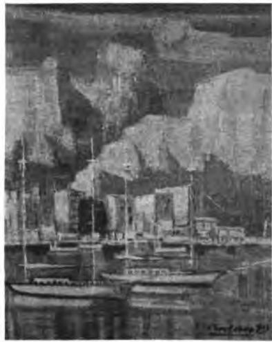
Port de Pollença, obra de Rafael Garau

perspectiva, pero se han de mejorar y mirar lo que verdaderamente interesa. Sobre todo hay ganas de trabajar y conseguir esta superación que hemos hablado antes.