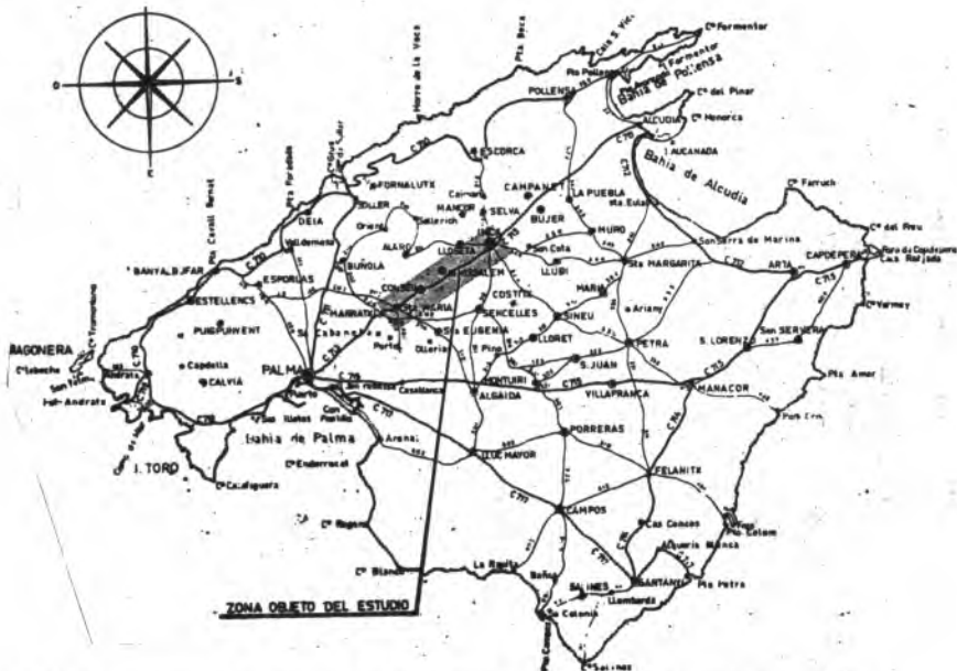
Sobre el mapa de Mallorca se aprecia la zona objeto de estudio afectada por la posible autopista.