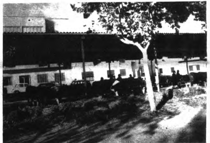
Nuestra provincia entre las primeras de ganado frisón.