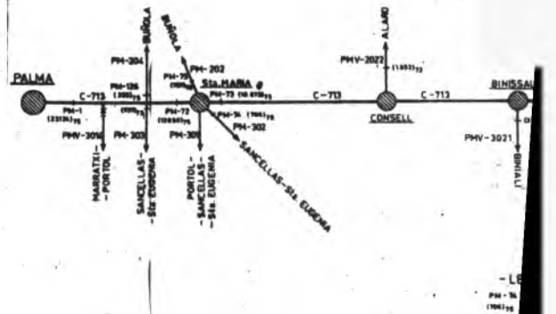
En el Croquis se detallan las poblaciones a