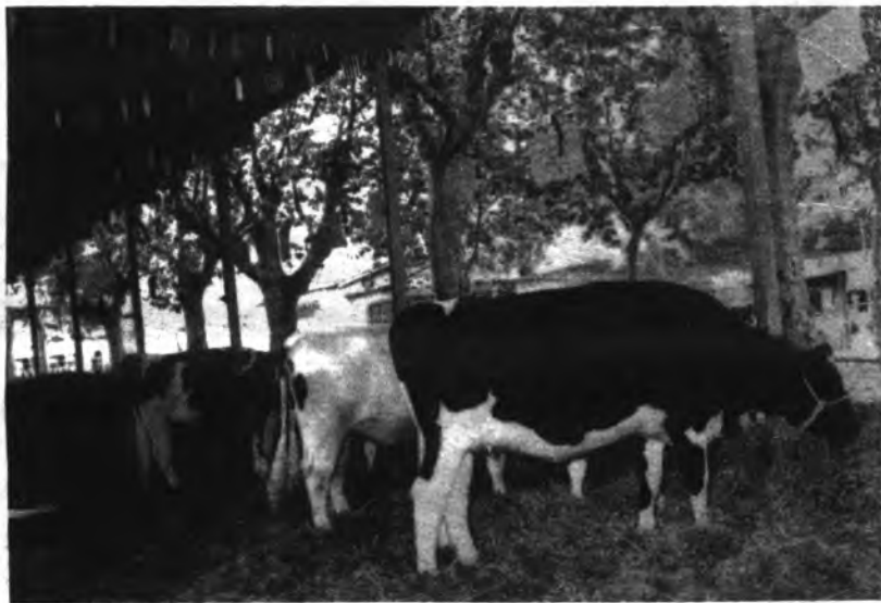
En ganado frisón se batió el record europeo.