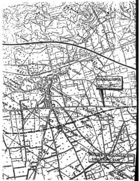
Aquí se ve la entrada de la Autopista debe causar los mínimos problemas, por la actual configuración.

Aquí se pueden ver las tres opciones previstas. En la primera, el trazado discurre por el norte, entre Consell y Alaró; esta solución debe descartarse debido al resurgir de las explotaciones mineras. La segunda es una solución puente, que parece inviable dado el actual trazado de la Autopista Palma-Santa María. La tercera, solución sur, parece ser que goza de mejores auspicios.