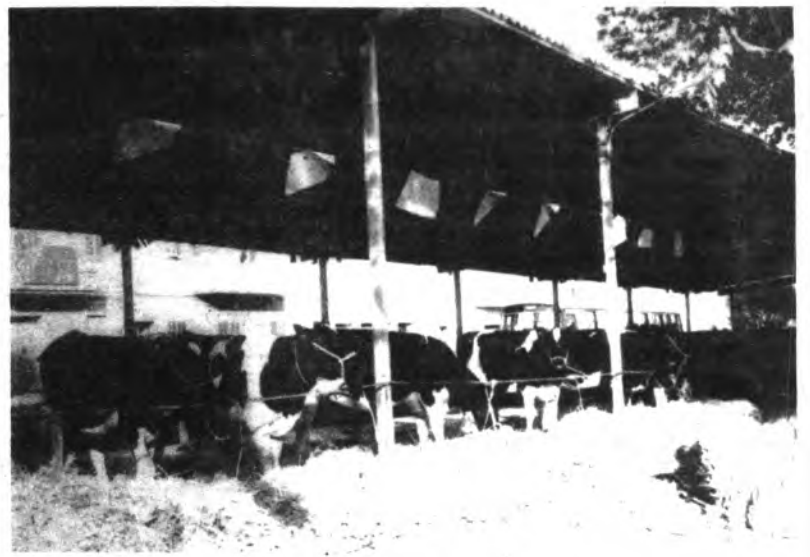
Detalle de la exposición.