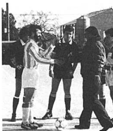
En Damia, rebent el premi de Dies i Coses