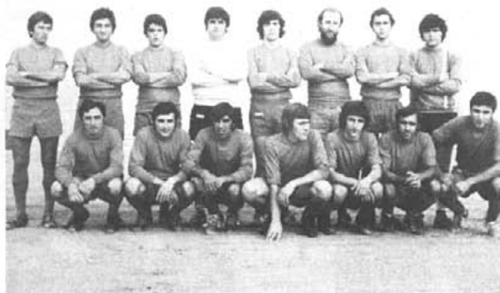
C.D. ALQUERIA (3ª REGIONAL), 76-77 - C.D. ALQUERIA (JUVENIL), 78-79

Recordant els inicis d'aquest club, se disputarà un partit entre els integrants de les dues primeres plantilles que hi va haver. S'intentarà repetir els dos onzes inicials que varen saltar al terreny de joc el primer partit de lliga.