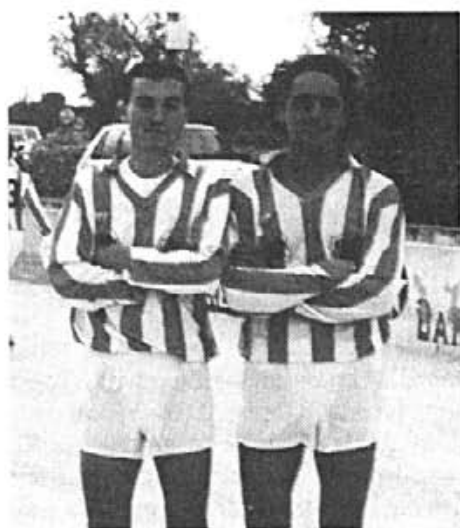
En Tomeu i En Jaume han anat a més.