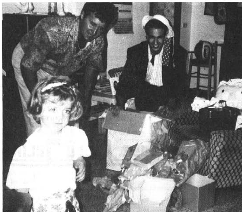
Quan ve en Joan ve carregat de obsequis

risme a nivell d'hotel: piscina, sol... els records que allà hi ha hagut la cultura maia que va desaparèixer fa uns cinc cents anys i ningú no sap com va sortir ni com va desaparèixer, varen fer una sèrie de monuments i piràmides increïbles. Mèxic també és el país de les festes, ja que allà celebren totes les dels Estats Units, les d'Espanya i les de Mèxic, pel que aquí sí que es pot dir «cada dia és festa».