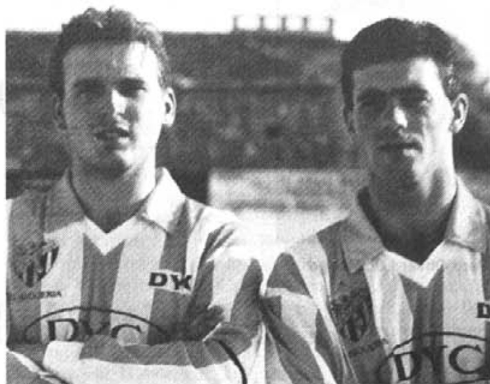
Edu i Villa: «no sabem lo que ferem l'any que ve»

En Villa, pel que fa a la pregunta de si hagués deixat el futbol si no li haguessin donat la baixa, ens ha dit que «els que ens n'hem anat, teníem la paraula del president que ens donarien la baixa si no es complien les condi-