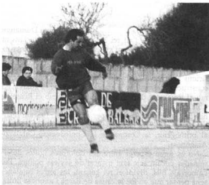
En Julián ara juga a «sa lleona»

cions promeses per mor del que va passar l'any pasat i si no haguéssim arribat a un acord les coses haurien empitjorat i nosaltres no haguéssim jugat».