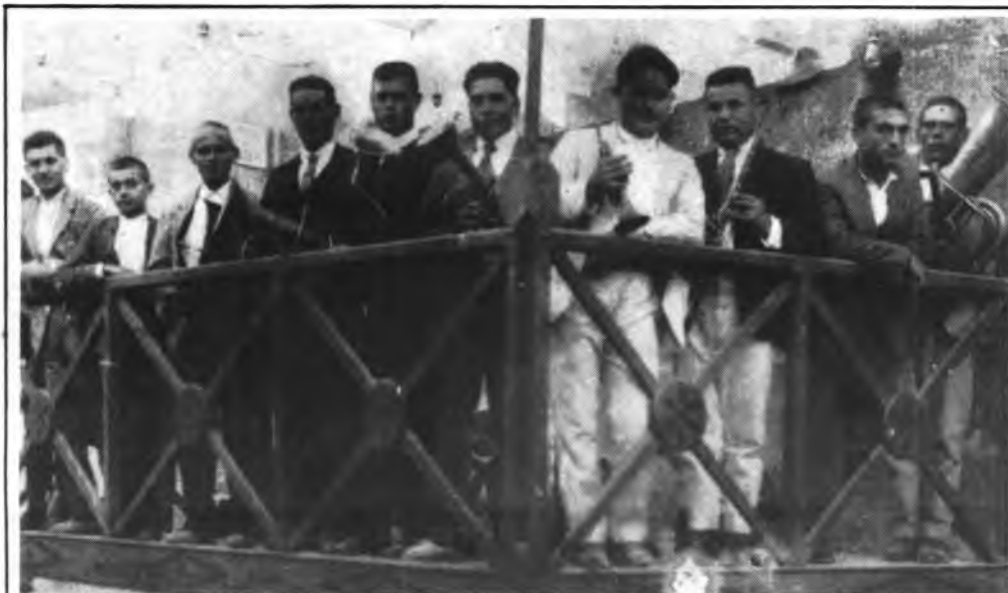
BANDA DE MÚSICA DE BÚGER que amb les seves actuacions va honrar el nostre poble de l'any 1909 fins al 1936, allà qual dia 30 d'aquest mes d'abril tributarem un gran homenatge.