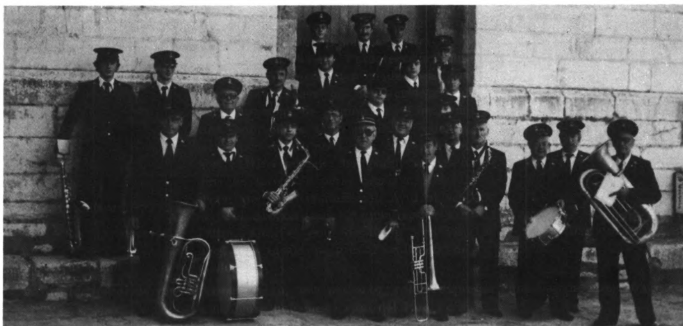
BANDA MUNICIPAL D'INCA • DIRECTOR: V. BESTARD GARCIAS QUE ACTUARA EL DIA 30 D'ABRIL

La Comissió de Festes es reserva el dret de poder canviar el programa, si les circumstàncies ho reclamassin.