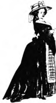
SENYORA AMB CULER

Tot pareix carn natural entre davants i culer. Lo que és a ca's pedasser ja deu fer un bon capital. Però no hi ha res legal, tot són quatre escarabats i entredós mal brodat per parèixer xerafins. Si les véssem per dedins quedariem encantats.