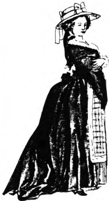
SENYORA AMB CULER

Hi ha culers que són de palla i també de serradís: Dir-ho ben clar és precís que una al·lota así s'estralla. Es meneo sempre ensaia perque d'ella s enamoren, als joves que no discorren els llama l'atenció i d'aquesta preocupació amargament bé la corren.