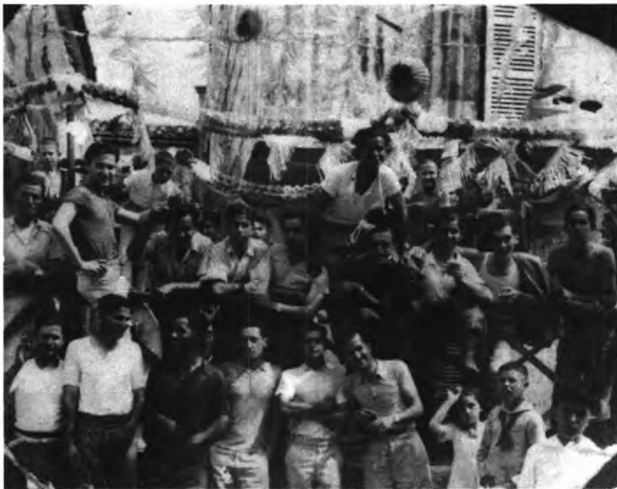
GRUP DE JOVES DE BUGER (1932) FESTES DE SANT PERE