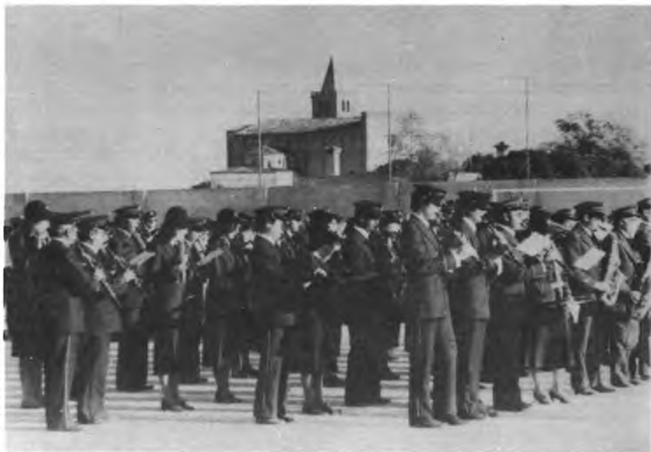
Banda de Música "La Filarmònica".

El proper dia 3 d'octubre, tindrà lloc a la Vila de Porreres, un gran aconeteixement artístic-musical, amb motiu del 125 aniversari de la fundació de la Banda de Música "La Filarmònica de Porreres".