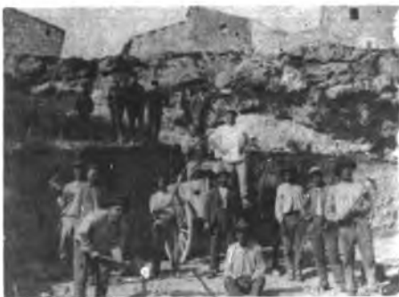
Treballadors de Ca's Mestres. (Any 1923).