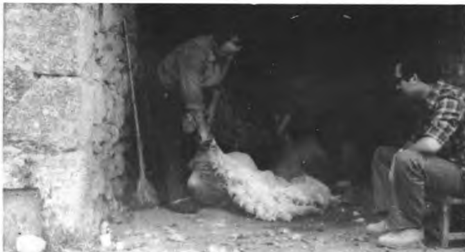
Ses toses, antany era tot un art.

Sa madona va contenta quan veu que duis interès, però encara hi està més quan l'Amo li pitja es ventre.