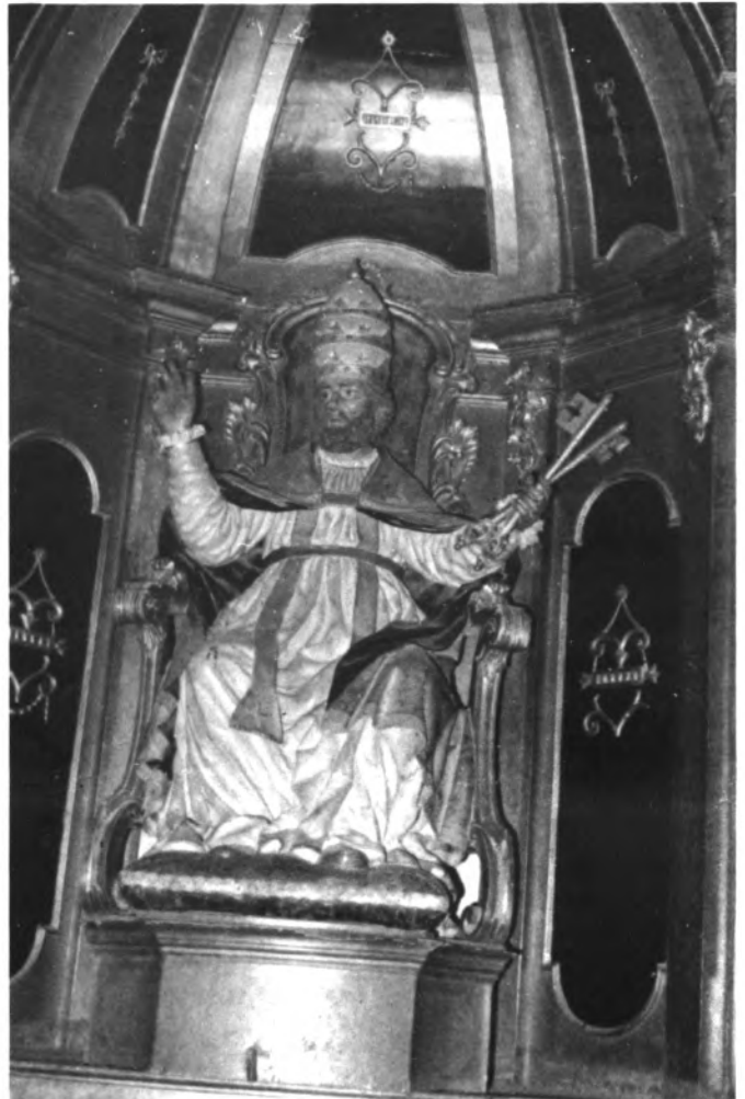
Imatge de Sant Pere, patró de Búger, obra de l'escultor sencer Miquel Llabrés. Principis segle XVIII.

No es pot dar feligresia que us veneri amb tant d'amor; Búger tot en vos confia, Oh Sant Pere, gran patró.