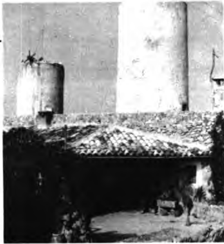
Es molí d'Es Rector (avui de Ca's Mestrès).