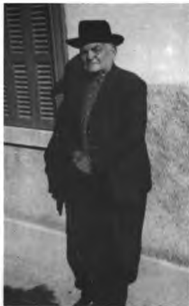
L'Amo En Pau Pola, camperol, ja ben empés, decideix aprendre a fer culleres.

De totes aquestes dades podem deduir que les dècades dels anys 40 al 80 del segle XIX —cal tenir present que aleshores Búger té el cens més elevat de la seva història, 1.228 habitants— pertanyen a l'Edat d'Or de la nostra original artesania. Es en aquest sentit que l'Arxiduc Lluís Salvador, a la seva obra "Costumbres de los Mallorquines II", descrivint la casa pagesa mallorquina, es veurà obligat a parlar de les culleres de Búger: "en otro lado está el "cullarer", cucharateo, que consiste en una tabla provista de ranuras donde se meten las cucharas. Estas cucharas suelen ser de madera y se labran en Búger; entre ellas acostumbra a tenerse algunas más finas de boj, de cuya leña suele ser también el "cullerot", cucharón,..." 18 .