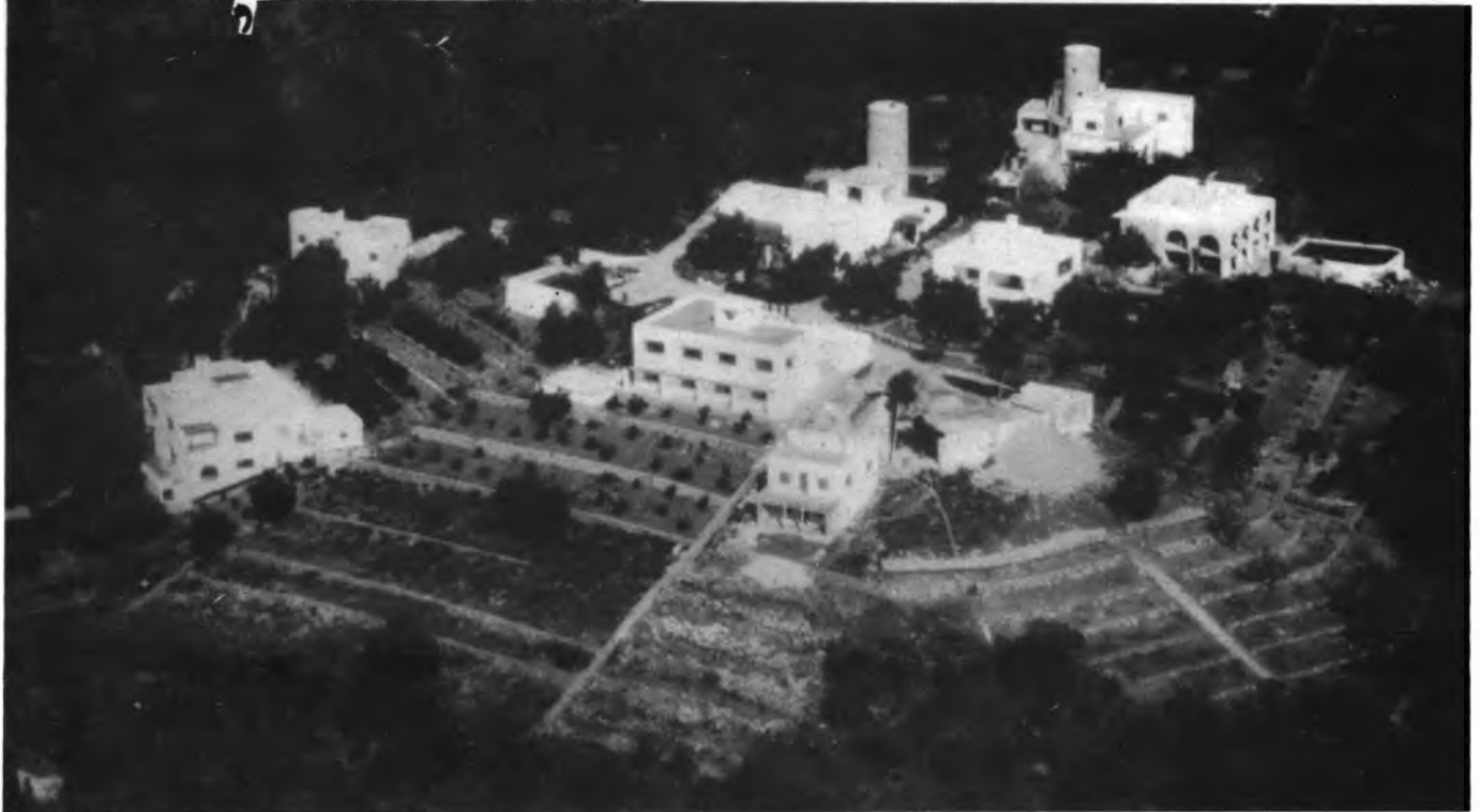
"Es Pujol". Perspectiva, des de l'aire, feta fa 17 anys.