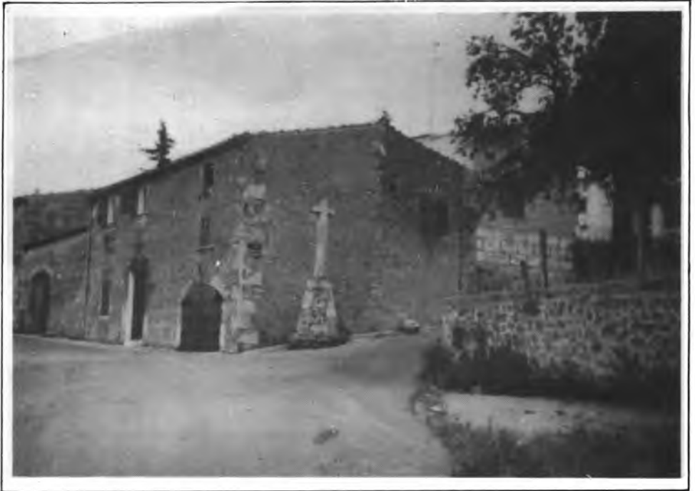
Creu de Son Paulo, destruïda l'any 1936.