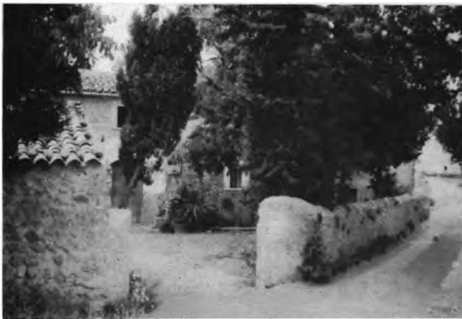
Cases d'Es Rafal de Ca'n Mascaró.

Si analitzam el quadre estadístic i la representació gràfica d'aquestes dades podem veure que ja a mitjan segle passat hi havia una gran fragmentació de la terra, lo que es denomina minifundi era predominant, un gran nombre de petites finques que representen quasi un 15 o /o de la extensió total del terme, i un gran nombre de petits propietaris que sense cap dubte no es poden viure del rendiment, sino que han d'anar a jornal a possessions de pobles veïnats o dedicar-se a altres oficis.