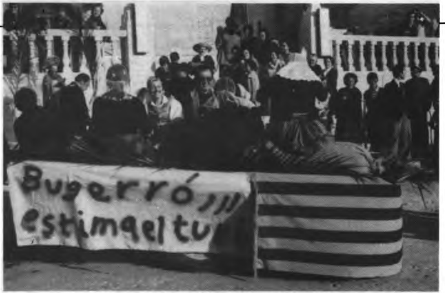
Contribució de l'Obra a les Beneïdes de Sant Antoni 79.