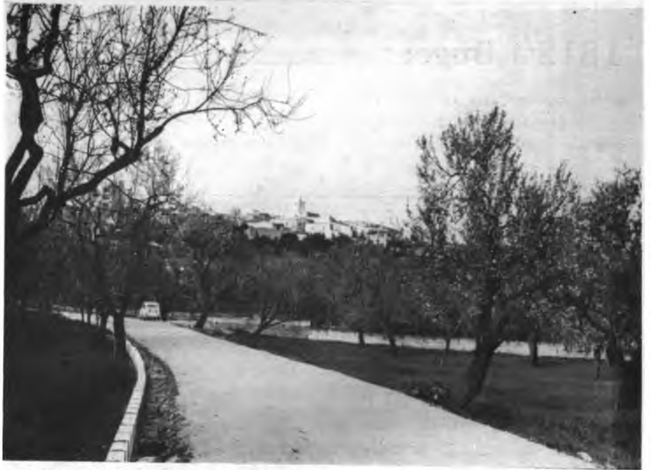
Perspectiva de Búger, vista des de Ca's Povil.

El passat diumenge, 6 de maig, tot Búger estava de festa. Al bosquet de Ca's Povil es celebrà la festa d'Es Jai; festa recuperada gràcies a l'Obra Cultural Balear a Búger, ja que feia prop de quaranta anys que no es celebrava.