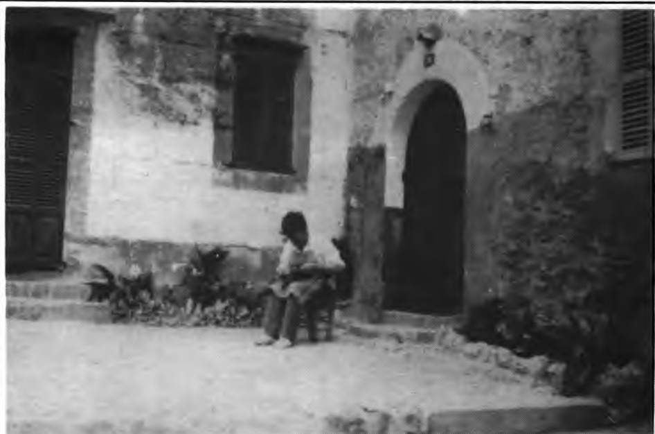
Un racó d'Es Ravelleret.

Encara quan pot semblar un joc de paraules, el problema s'inicia en el principi.