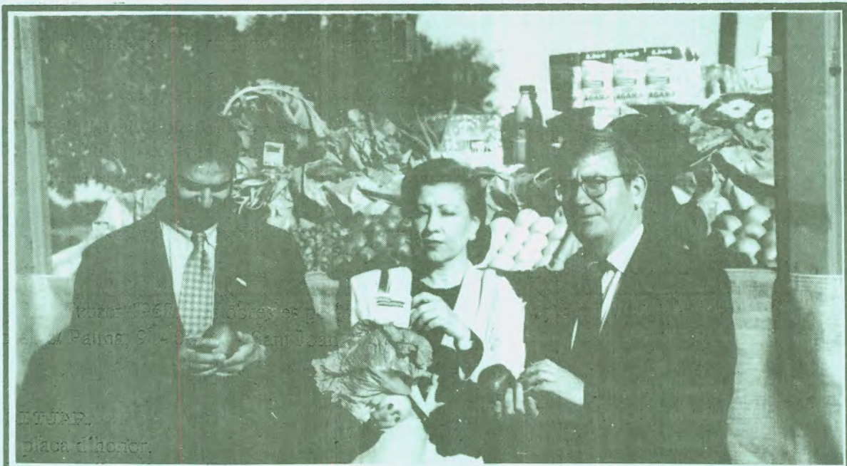
ETJAP. placa d'honor.

REVISTA D'INFORMACIÓ LOCAL - SANT JOAN - GENER 1.997 - NÚM. 68