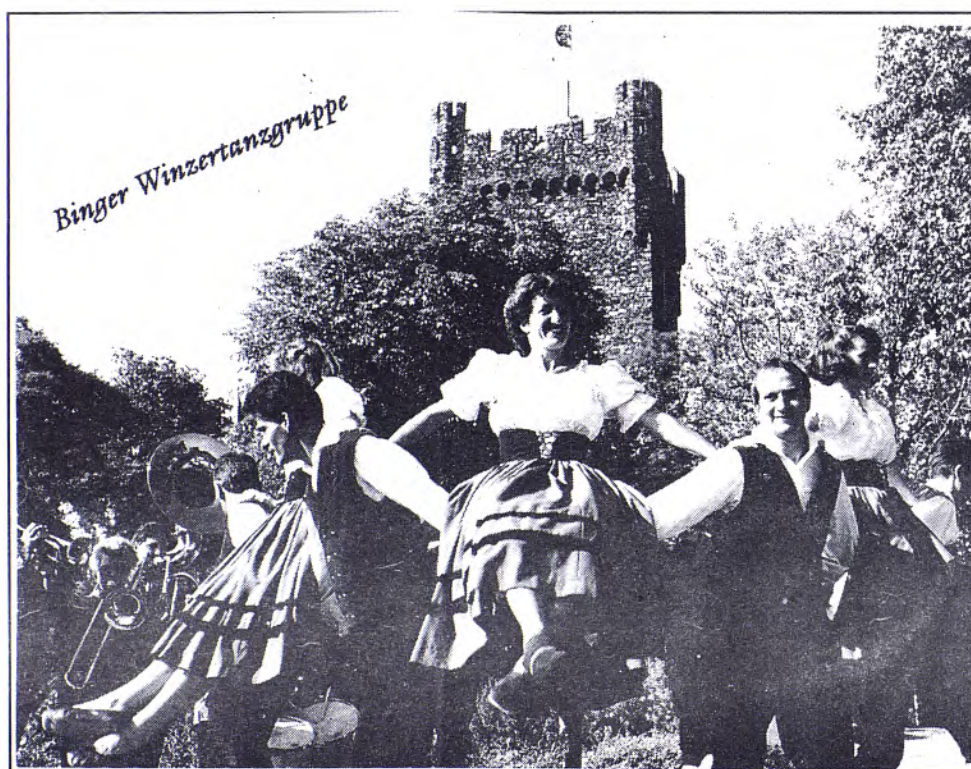
El conjunt de vinyaters de dansa de Bingen