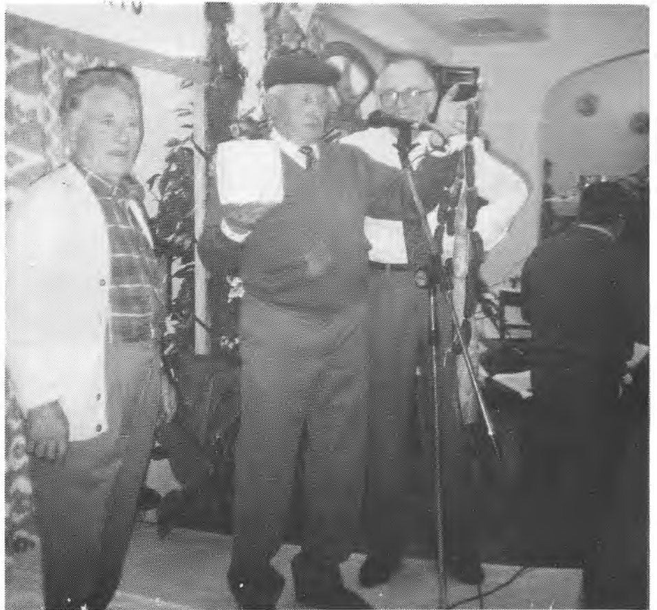
Un any més aquesta estampa de la subhasta de porquim, clourà el dinar de la Penya Motorista en el 37 Aniversari

La Penya Motorista Sant Joan anuncia per el dia 12 de desembre la celebració de la Diada del 37è Aniversari.