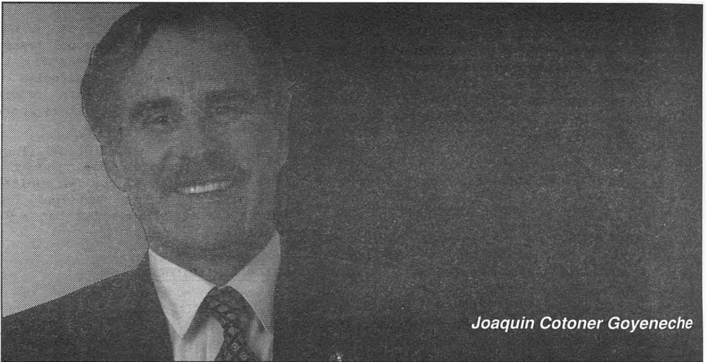
Joaquin Cotoner Goyeneche

la sanitat i l'educació. Per defensar les pensions dels nostres majors. Ara el PP ens ofereix un contracte de mútua confiança, un Govern per a tots. Depèn del teu vot.