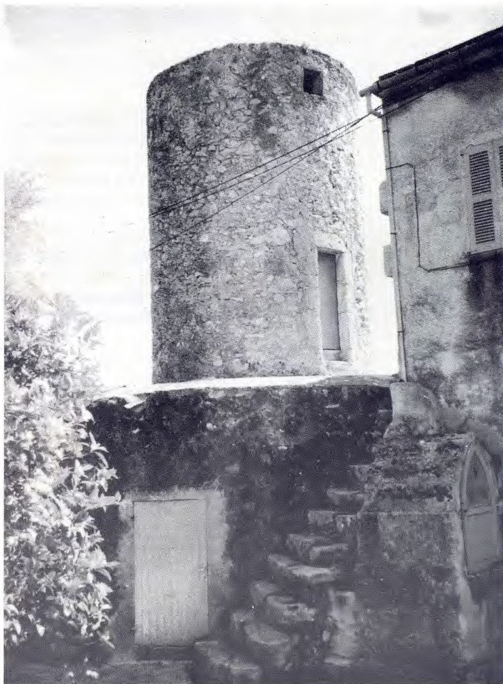
Molí d'en Tronca (Sant Joan)