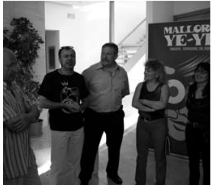
Inauguració de l'exposició Mallorca YE-YE