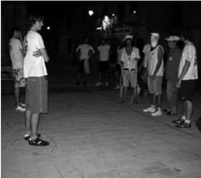
Prova de la gimcana juvenil