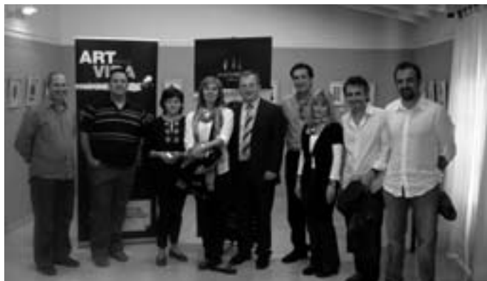
Inauguració de l'exposició "Art per la vida"

Des d'aquestes pàgines vos feim ressò de les activitats organitzades a la Biblioteca Cas Metge Rei les darreres setmanes.