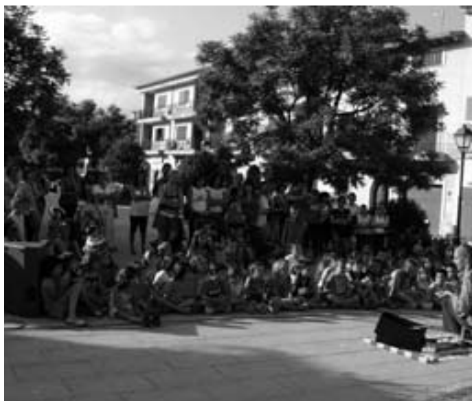
Contacontes del Rei en Jaume