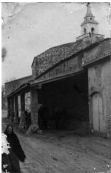
Les porxades de can Millo.

Els carros van anar desapareixent a mesura que els camions comencaren a fer la feina. A Santa Maria recorda que hi havia el camió del Senceller i també el d'en Parró, en Penós, en Noguera...L'ofici de traginer es correspondria amb el dels transportistes i camioners actuals.