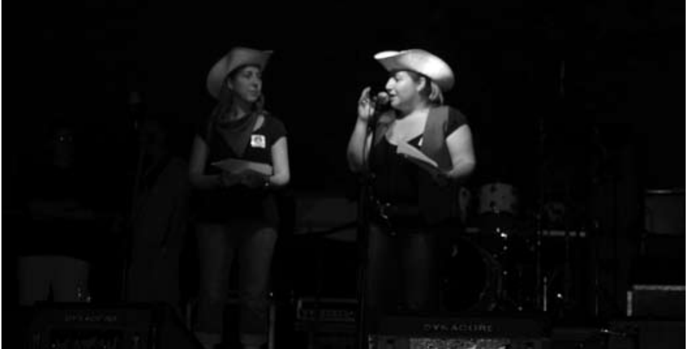
1a Gimcana juvenil de l'Oest