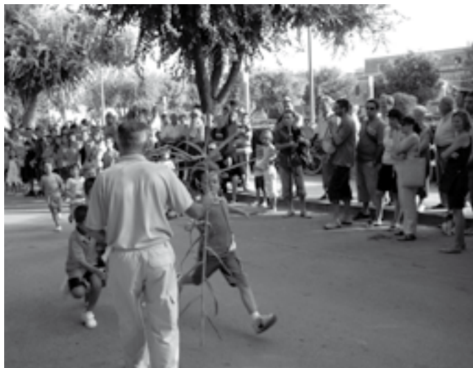
Corregudes de joies