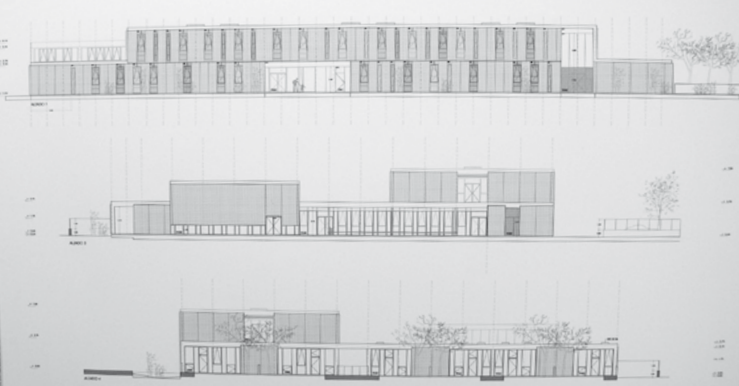
Plànol dels alcats del nou CEIP; el de dalt de tot és el principal, és a dir, el de l'accés al centre.

d'equipaments 2008-2009, del qual el de Santa Maria n'és un dels primers, al mateix temps que estudiaran les peticions realitzades.