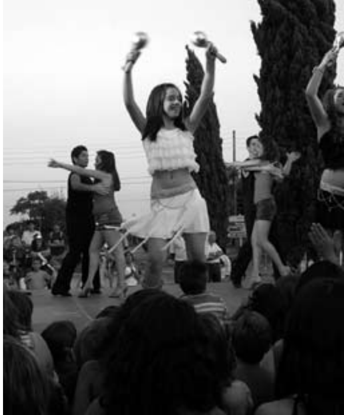
Actuació del grup Eclipse