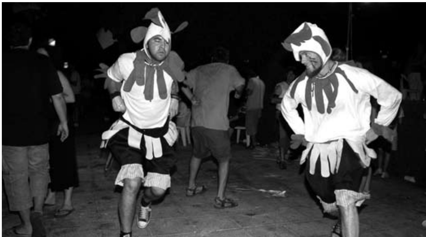
Els Galls de possessió