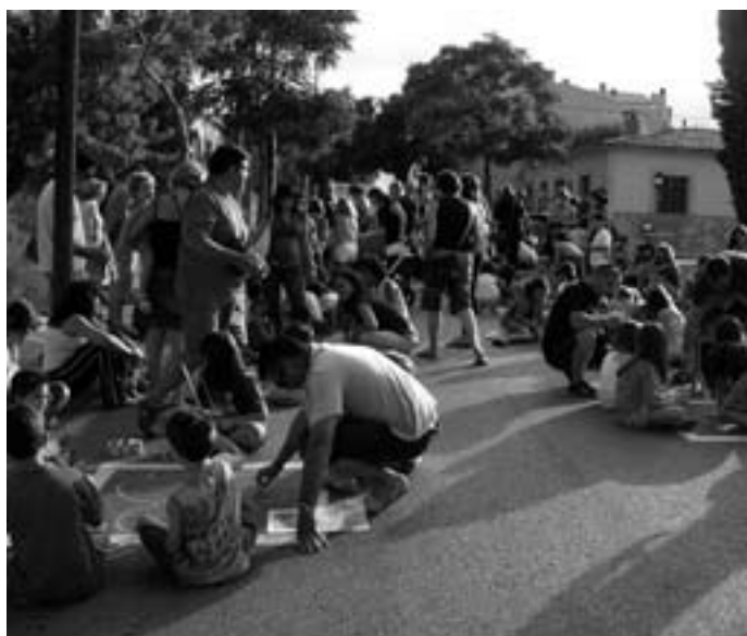
Pintada pel carrer Jaume I

estar tancada i els participants quedaren fellons!