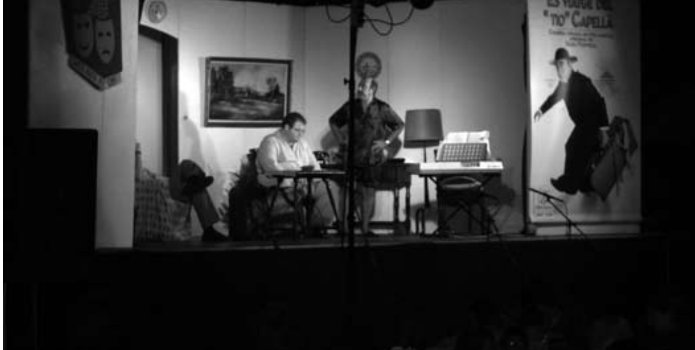
Grup de teatre s'Escoleta