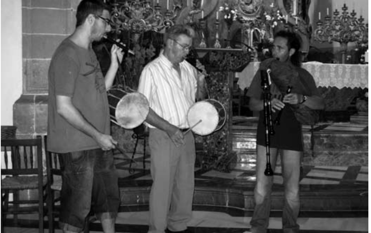
Sonada dels Xeremiers Santamariers

Acabada la missa, i als peus de l'altar major, es reté un sentit i ben merescut homenatge a l'insigne mestre de xeremiers.