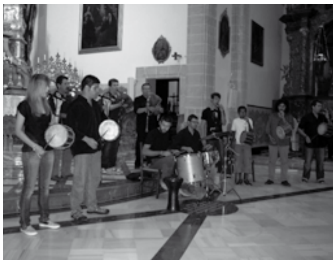
Xeremiers de Muro