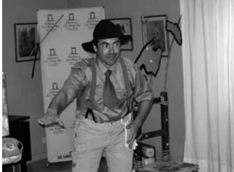
El professor sorpreses a la terra del miotragus