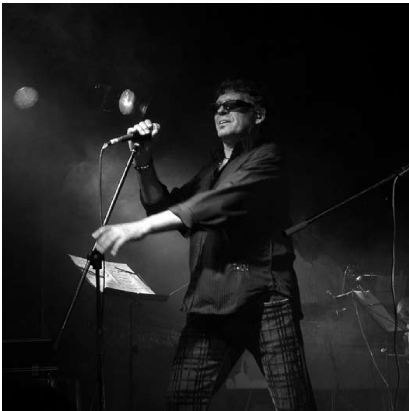
Actuació de Llorenç Santamaria