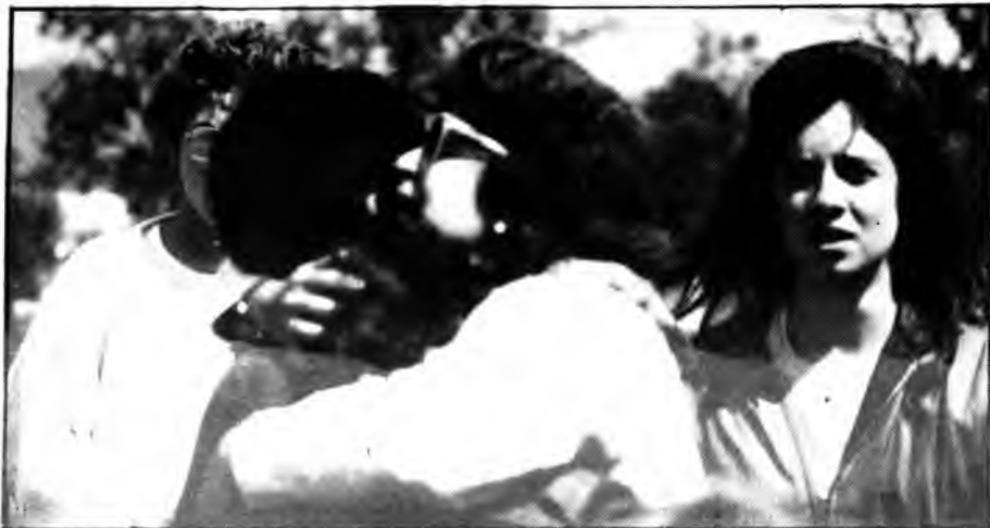
No faltaren els moments emotius i les llàgrimes.

llor «Mira que si ara volguessis reprendre al teu germà i tornar-li totes ses galtades». Tots feim una rialla.