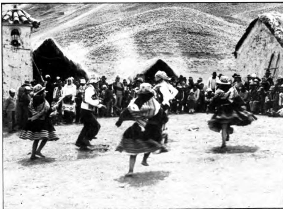
Aquesta fotografia mostra el dia en què els nostres cristians celebraren la recuperació de les terres. 10-XII-86.

No sé com vos anirà la foto. Crec que bé amb el nou disseny. Si així fos hi podreu contemplar la plaça d'un dels nostres pobles. Es diu SELQE i està a 4.200 metres d'altura... Per això mateix no hi veureu ni un sol arbre. S'hi veu l'Ajuntament -casa comunal- diuen ells, a ma dreta. El campanar diu on és l'Església, el temple. Amb dues cases d'acollida -«els cafes»- del poble. Acabam de sortir de missa. Es un dia gran. ACABEN DE RECUPERAR UN BON TROS DE LES SEVES TERRES. Per això vesteixen de festa i ballen. Perquè com canten «ja no som orfes» tenen ja la SUMADPACHAMAMA = LA SANTA MARE TERRA.