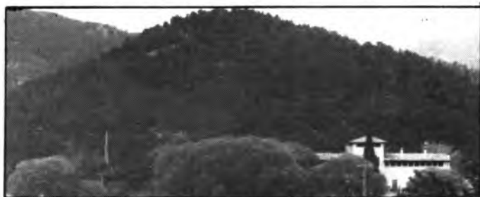
El Puig de n'Elena s'aixeca per darrera les cases de Son Torrella.

A Sóller a un penyal que hi ha dins mar li diuen «Es Penyal Bernat», aquí de cavall s'ha pasat a penyal. A Santa Maria ens trobam amb una solució ben apropiada, i que no hem vist a cap altre lloc. Un batall és una peça cilíndrica de ferro que penja dins la cavitat d'una campana o esquella, i la fa sonar. D'altra