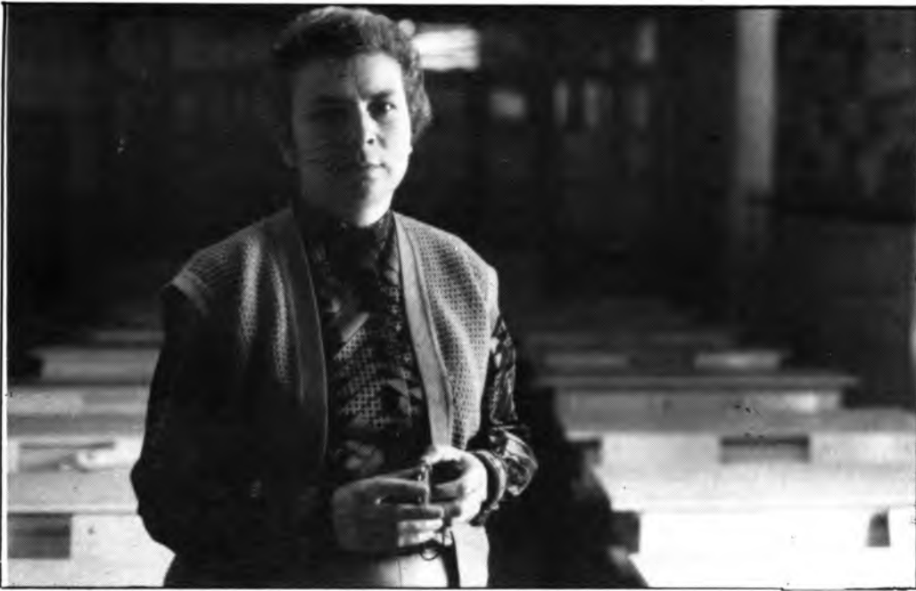
El meu objectiu és viure i conviure amb els alumnes.

-Ara mateix som tretze monges, totes amb actiu, manco Sor Francisca (sa sordeta), que està al llit, i encara dins els seus coneixements sap fer unes bones rialles i ser agraïda.