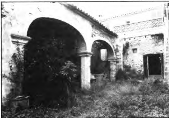
Vista parcial del pati de Cas Metge Rei.

Pel que fa al finançament, l'Ajuntament suportarà totes les despeses ocasionades per la festa. Ja ho sabeu, a la Plaça de la Vila, hi haurà sarau i festa per llarg. B.C.