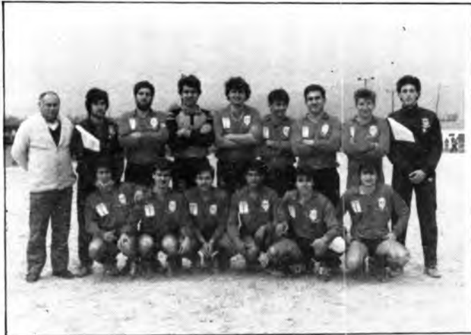
Equip de 3 a Regional de Santa Maria

En una edició anterior, vàrem comentar que un grup d'amics del poble i amb el nom d'Unió Esportiva Sa Font, estaven duent a terme, una gran campanya a la lliga de futbol aficionats d'empreses.