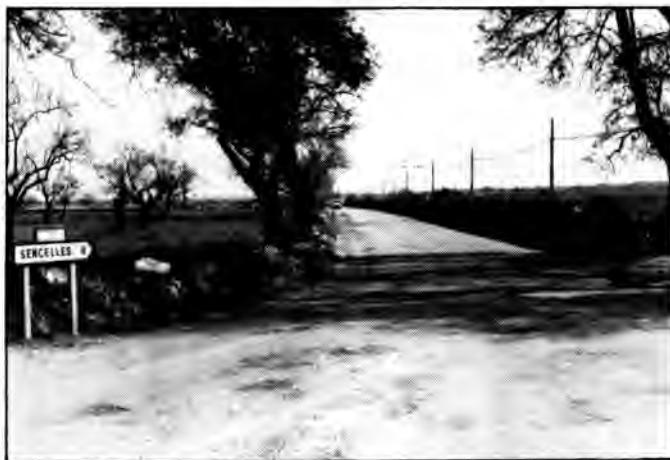
La carretera de Sancelles, una possible alternativa

El 4 de novembre de 1986, a Inca, el Govern hi organitza una «taula rodona» sobre el tema, amb la participació de