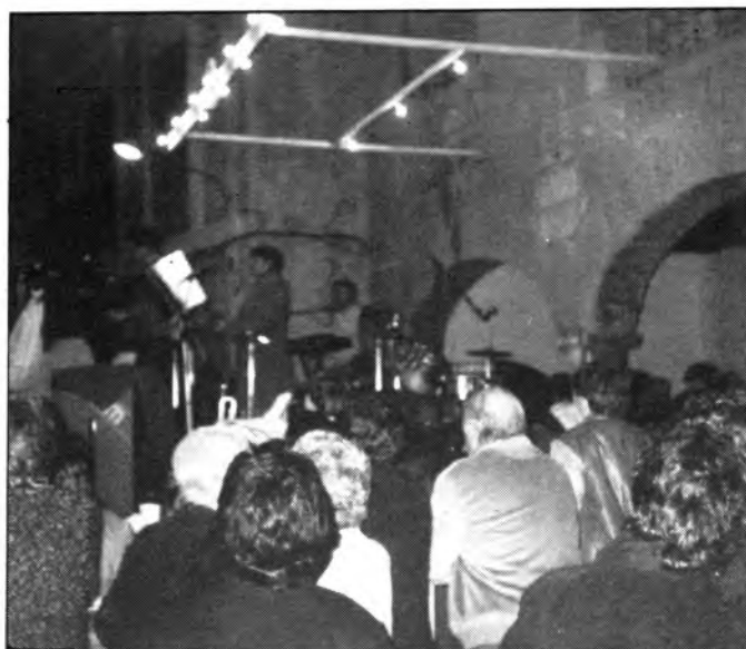
Molta gent mirant, i el consistori «xupant micro». Típica estampa.

Arribats de bell nou a la plaça de la vila, la història se començà a semblar més a la dels anys anteriors. Festa, allò que es diu festa, poca. Tanta sort que el conjunt tocava i animava una mica la cosa. Així i tot els qui ba-