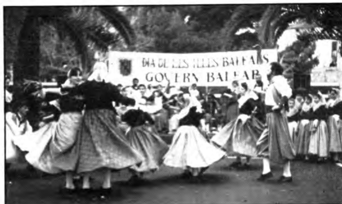
Actuació de Tanys Novells a Sineu

Santa Maria també participà a la festa, amb el Grup Tanys Novells; segons el programa establert havien d'actuar el quart lloc, però com sabem els programes són perquè no es compleixin i l'organització els va fer ballar en segon lloc. La representació estava formada