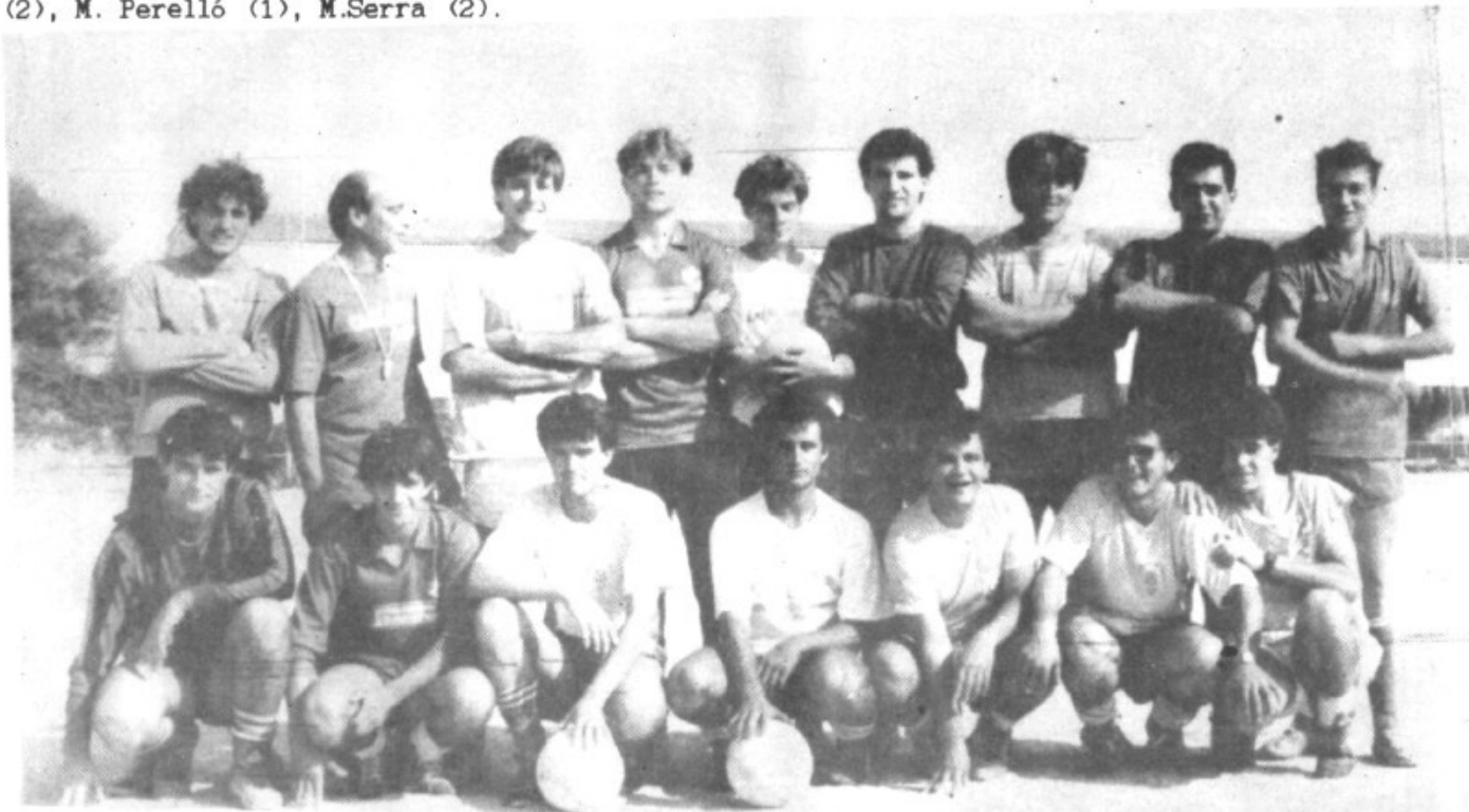
EQUIP TERCERA REGIONAL CDA LLUBI TEMPORADA 88-89.