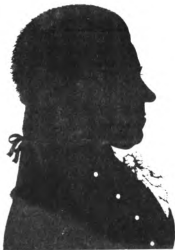
PETITA RESENYA DE L'ANY MOZART - PROKOFIEV

Finalitzat l'any Mozart crec que tota alusió a la seva vida, obra, mort o influències artístiques del compositor, a l'història de la música ja està més que feta. Tant a la premsa com a qualsevol medi de difusió; tant a les biografies reeditades aquest any amb motiu del bicentenari de la seva mort com en els llibres escrits i publicats expressament per la commemoració. I no parlem de la difusió massificada de les seves 41 simfonies, duets, tríos, quartets, quintets, òperes i operetes, i sobretot, del seu "Requiem" del que en contades ocasions s'ha anomenat la persona que el va acabar, el seu deixeble Lüssmayer.