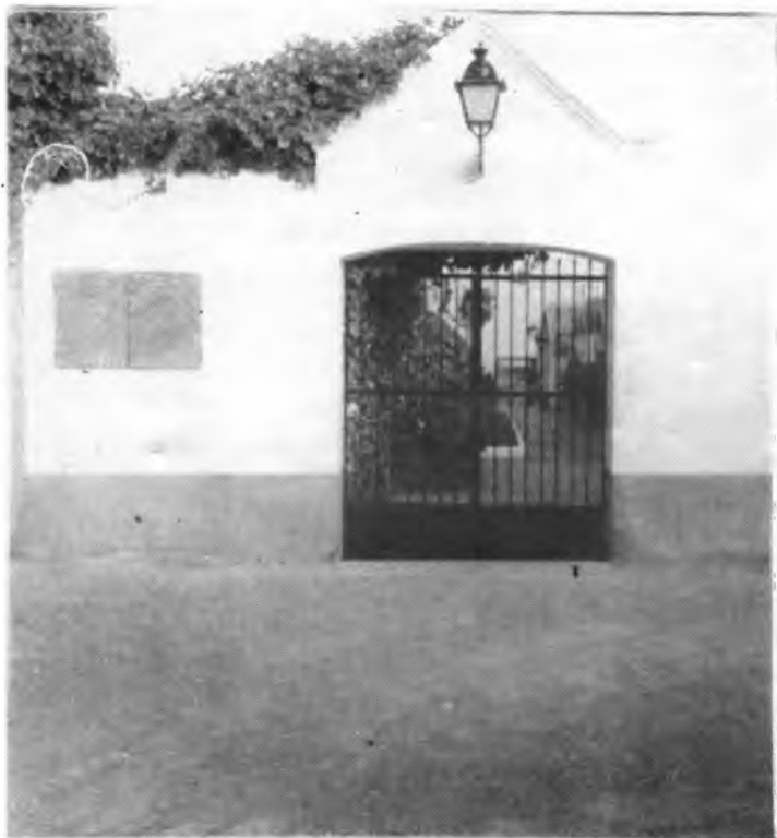
A l'esquerra de l'entrada, on hi ha les portetes d'alumini, es trobava l'entrada al Cementeri Civil.