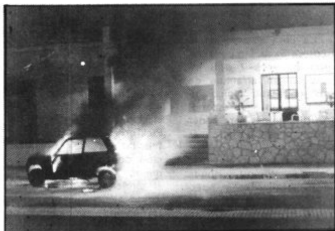
ARDIO UN COCHE FRENTE AL CLUB NAUTICO.

El pasado 27 de Agosto ardió sorpresivamente un coche aparcado frente a las Oficinas del Club Náutico, reuniendo gran cantidad de mirones sin que nadie pudiera hacer algo para extinguir las llamas. Al fin se personaron los bomberos de Santa Margarita que ya nada pudieron hacer para "salvar" al incendiado vehículo.