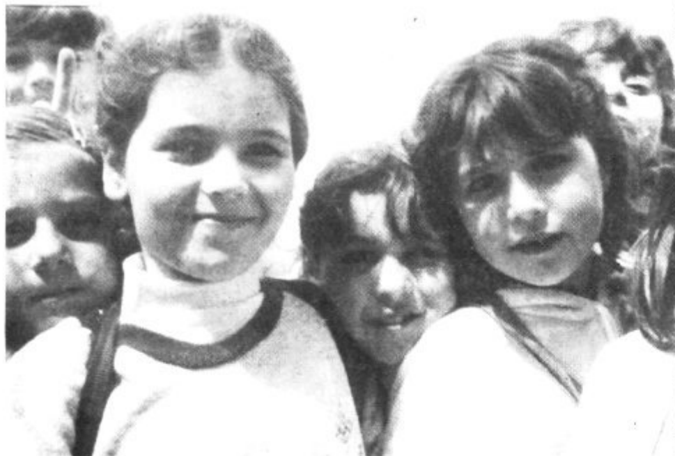
Niñas de la escuela Mixta de Ca'n Picafort el día de la excursión. Un momento de alegría y de descanso después de la comida en el Port Vell, son Servera.