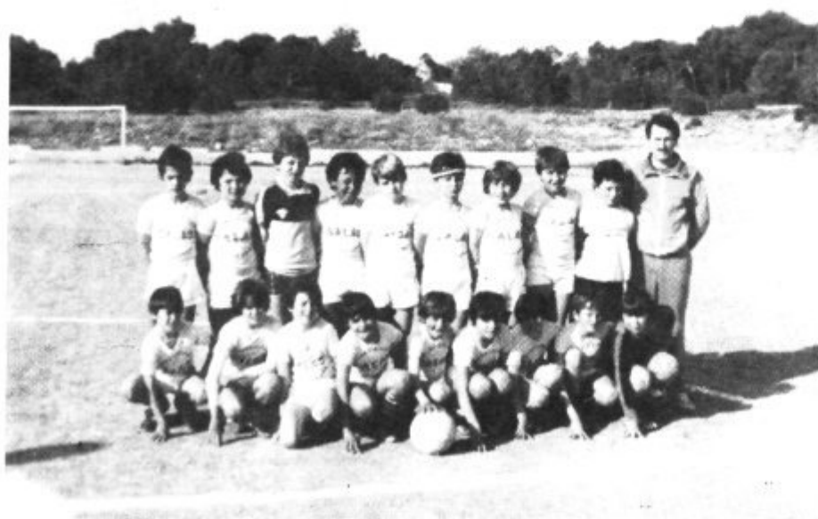
Equipo Benjamin de 1a U.D. Ca'n Picafort De aquí es donde saldrán las grandes figuras del futuro. Un equipo que empezó bastante flojo, pero que, en este momento, está considerado como uno de los mejores de la isla. Enhorabuena!.