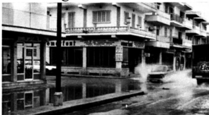
Imagen a cambiar