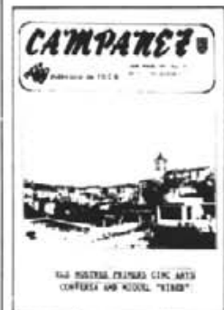
□ Cinc anys —. Al 87 la revista celebrà amb el número 30 els seus primers cinc anys amb un extraordinari. Al mateix temps es féu una exposició sobre mossèn Alcover