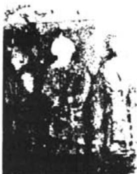
La creu de Sant Miquel o de Son Pocos.— Aquest era l'aspecte de la històrica creu que guardava gelosament la vall de Sant Miquel. A dalt podem observar ara com es troba ara el tros de creu que aguantava la imatge de Crist. Les figures humanes es troben sense cap.