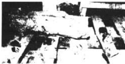
Així són els diferents trosos que quedaran «després de la venda». Ara estan guardats a un magatzem de la Casa Consistorial, a l'espera de que sigui restaurada.