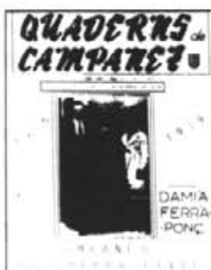
La guerra civil.