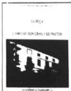
Un número polèmic.