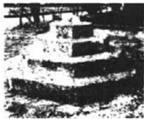
Devora l'oratori de Sant Miquel trobarem al peu de la creu de Son Pocos.