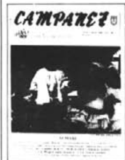
□ Nova imatge —. El darrer número editat ja surt amb una capçalera de color verd i amb una bona fotocomposició. Aquest motiu fa que augmenti el seu preu.