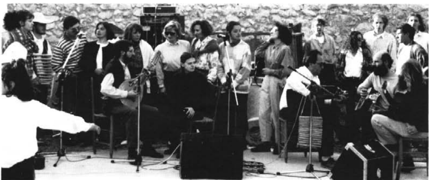
GRUP DE MUSICA DE L'ESCOLA DE BALL DE BOT