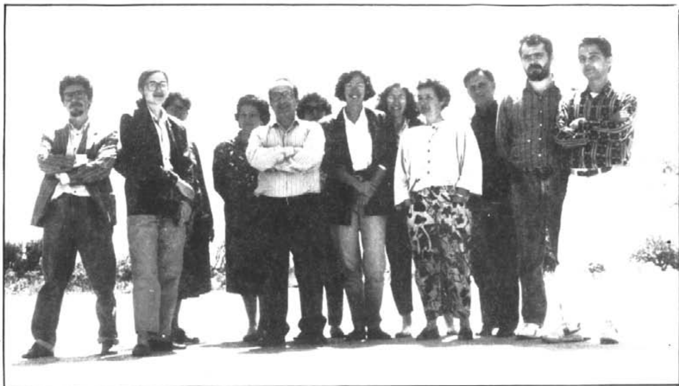
Claustre de Professors