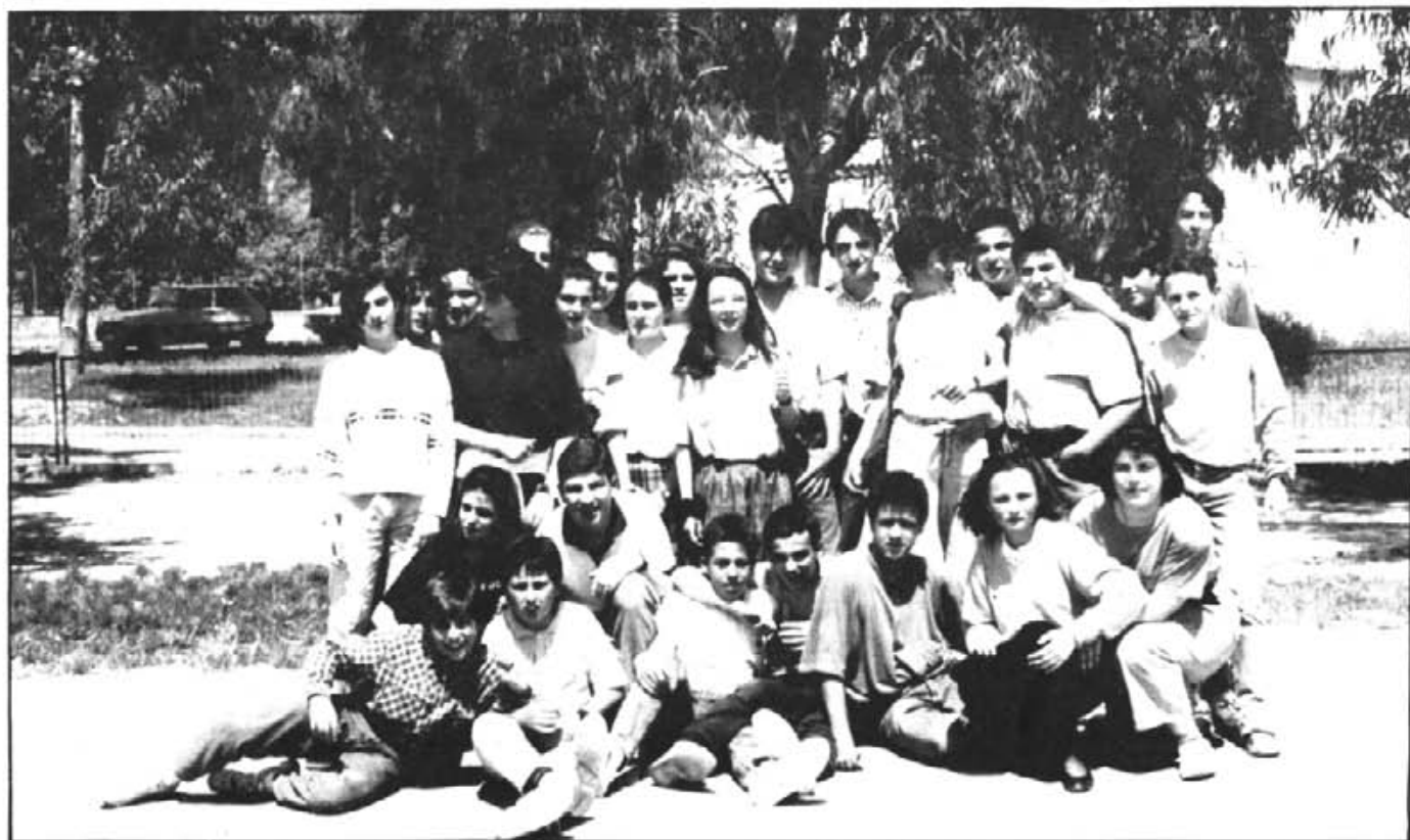
Alumnes de vuitè