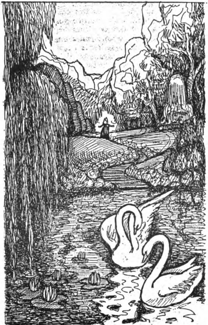
Segons la rondalla, el Pou d'en Gatell és la porta d'entrada a aquest jardí

A les RONDAIES MALLORQUINES de mossèn Antoni Maria Alco ver n'hi ha una titulada Es cor-pet des pou d'en Gatell que comença d'aquesta manera: "Ran d'es camí vei d'Inca a Pollença, no gaire lluny de Campanet, troben un pou que li diuen d'en Gatell. Ses venes d'aigo li venen de Lluç i diven que són tan grosses i tan fortes que en set llençols no les podrien tapar; això és que no l'han vist eixut mai ni que mancab gens, per molt de temps que estiga sense ploure. S'aigo que sobra, se'n va a un altre pou, set o vuit minuts enfora, que li diuen es Pouet". Al llarg de la rondalla se'n diuen més coses del pou, a través del qual ens introduïm en un jardí fantàstic: "aquest pou tenia dos poals a cada cap de corda, passada p'es corró". Els més vells encara ho recorden.