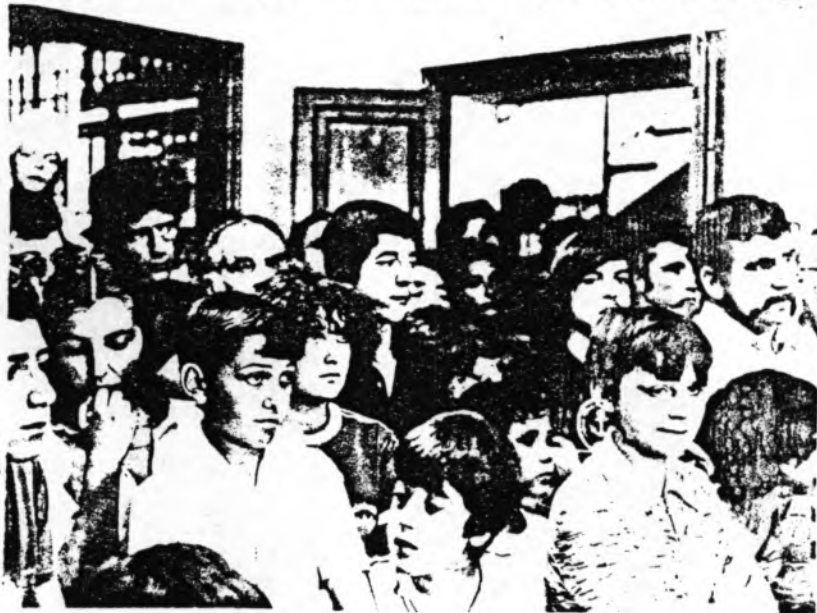
INAUGURACIO DE L'ARXIU

Vet aquí que en el llibre de Pòlisses del Clavari Sebastià Ponç, els regidors de la vila ordenen al caixer o clavari pagar "duas lliuras y cinc sous a Melsion