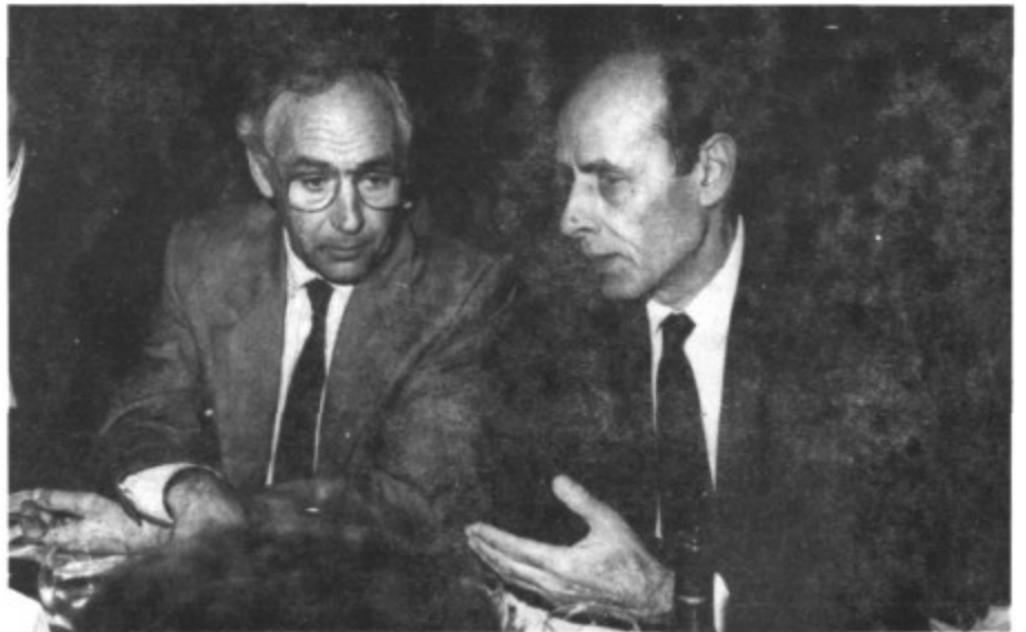
Alcalde de Capdepera y Sr. Tarragó