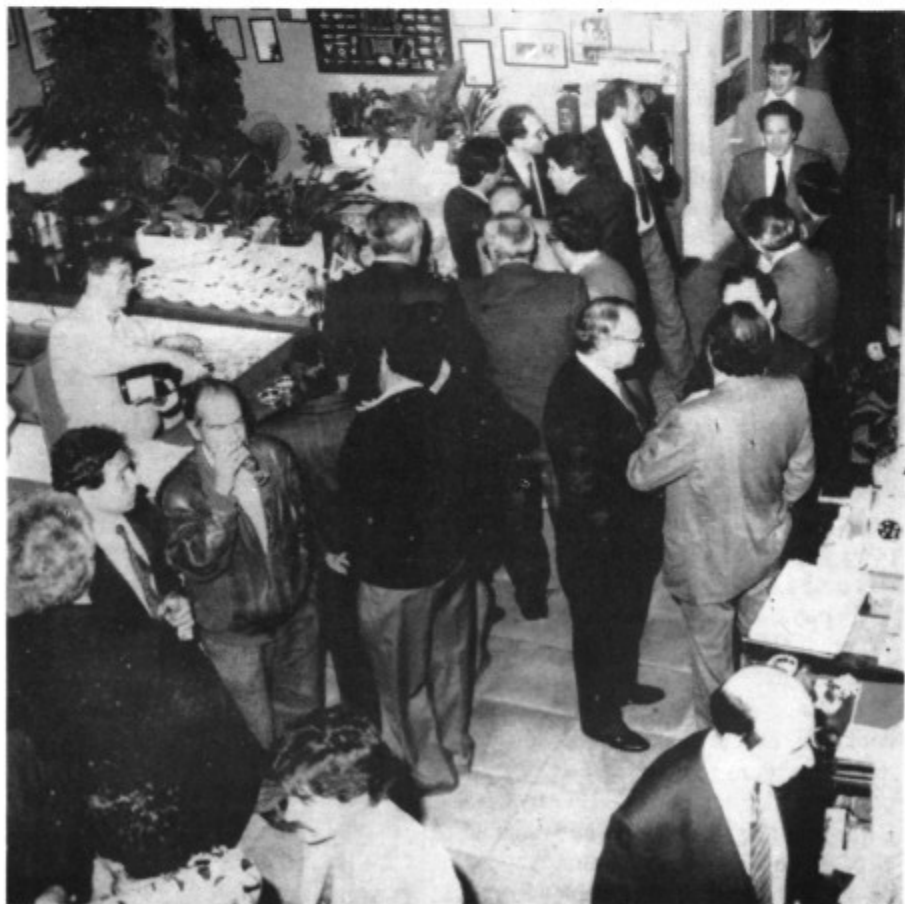
Un momento antes de la Tertulia

Muy seriamente quiero decir, que lo que hagamos de aquí, no al 2.000 sino al 95, será decisivo para el futuro económico turístico Balear. El tema es polémico y decisivo; desde el crecimiento 0 a un total juego de mercado hay el punto medio: un desarrollo