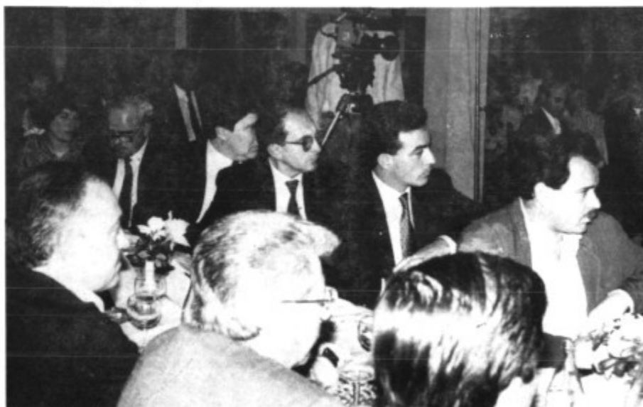
Durante la tertulia