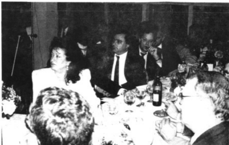
Un momento de la tertulia