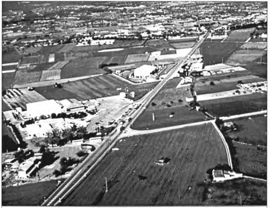
A Montuïri, a començaments de maig, poc abans de l'estiu l'anyada es presentava normal, tirant a bona, però... "no podem dir blat..."

Restaurant Ca's Carboner (DIMARTS TANCAT)