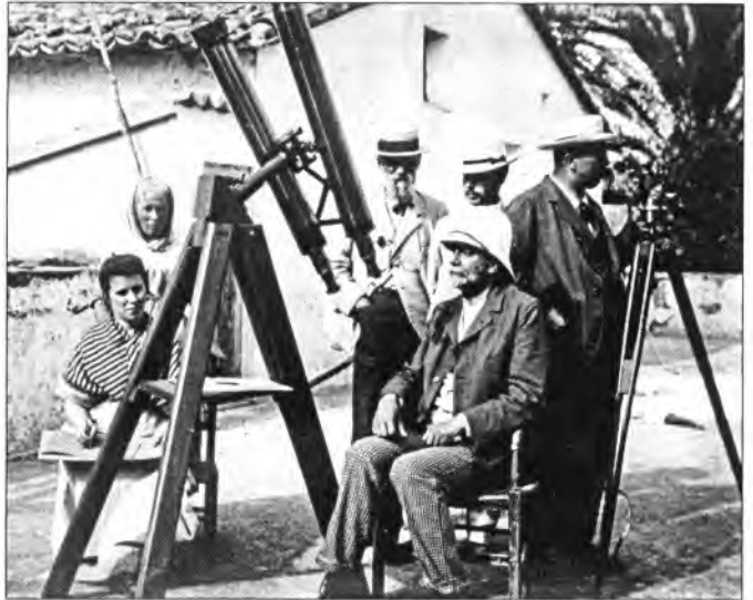
Membres de l'expedició suïssa desplaçats a Mallorca i dues dones mallorquines a una possessió de Santa Ponça