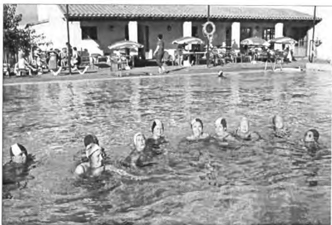
Aquest estiu la 3 a Edat també ha après i practicat la natació