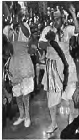
Ball de l'Oferta, 2004

El dimarts dia 23, dissabte de Sant Bartomeu, a les 19'15 començaran les completes amb l'assistència dels Cossiers. En acabar la celebració, veneració de la imatge de Sant Bartomeu i entrega d'alfabeguera.