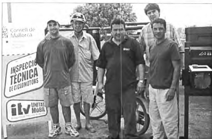
Representants de l'Ajuntament assistiren a la inspecció tècnica de ciclomotors en el Punt Verd