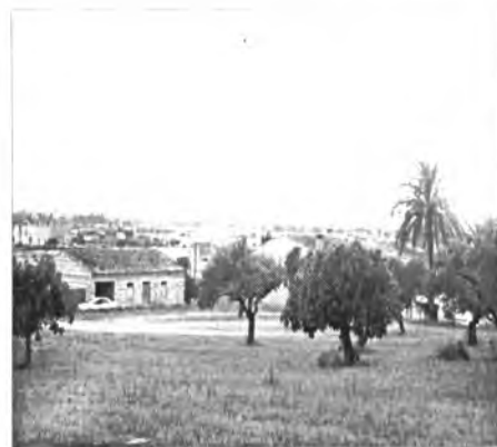
Posta de sol des de Montuïri

No en va l'oracle sibel·lí digueres a l'imperi romà, donant-li l'anunci d'un naixement meravellós. L'aurora d'un orde de segles descobrires des del cim de ton geni, i va nimbar-te un tendre raig de claror futura.