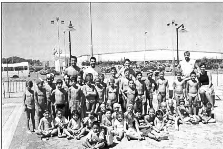
Els nins i nines que enguany van a natació a la piscina municipal gaudeixen de debò. I a la vegada els seus monitors estan satisfets dels seus progressos.

Cal dir que el nivell econòmic mitjà està en el 8