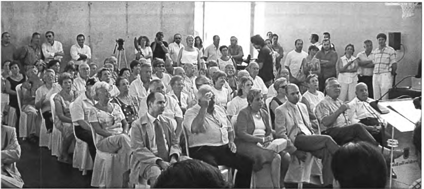
Vombrosos montuïrers varen assistir a l'acte matíu. El Batlle havia acompanyat abans la consellera a la col·locació de la 1ª pedra