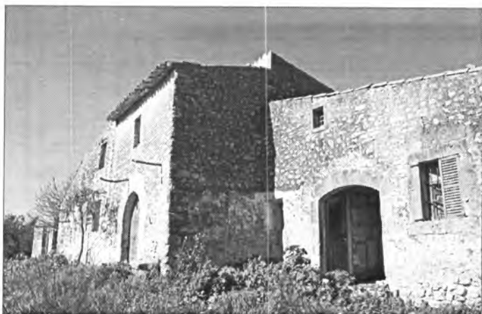
Les cases de la possessió de Son Fornés en l'actualitat