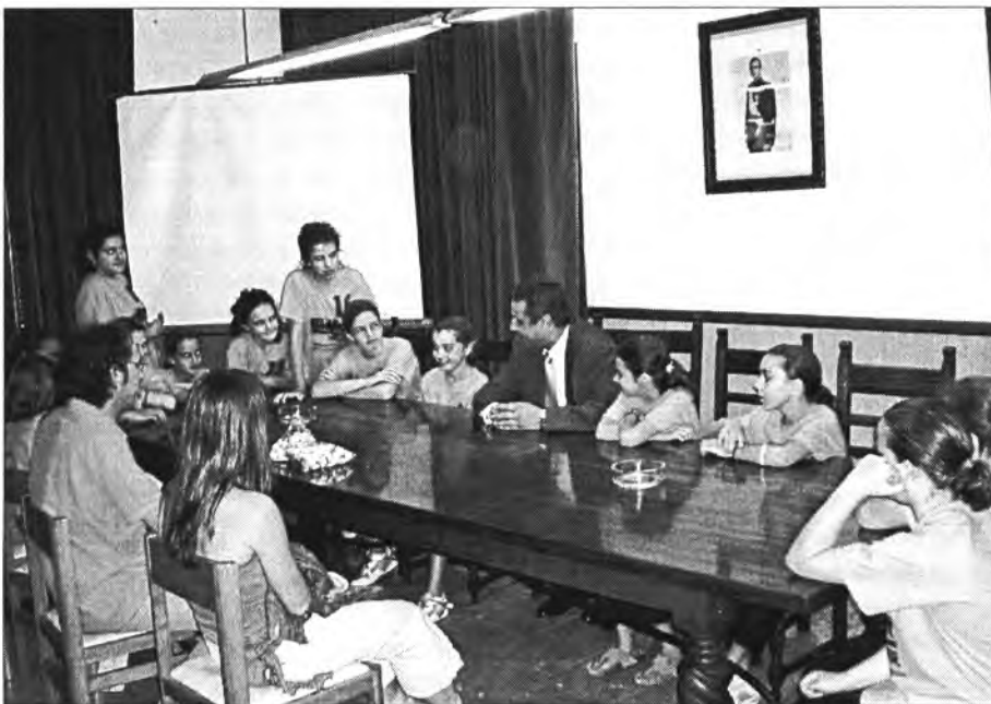
Les nines de minibàsquet dia 11 de juny foren rebudes pel batle a la sala d'actes després d'haver aconseguit el campionat de Balears de la seva categoria, on les va transmetre l'enhorabona en nom de tot el poble