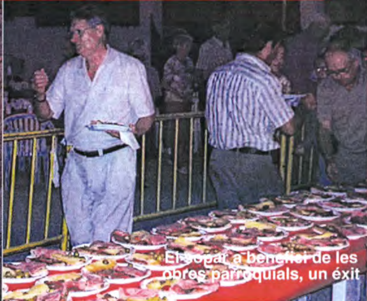
El sopar a benefici de les obres parroquials, un èxit