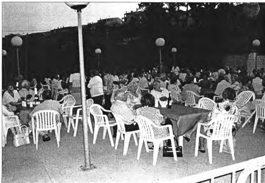
Els assistents romangueren complaguts en el sopar celebrat a la terrassa de la piscina d'Es Dau a benefici de les obres de la parròquia

El termini per presentar originals conclou el proper dia 21 i ja han arribat 22 treballs de diferents indrets de Mallorca i dels països catalans. Se n'esperen alguns de Montuiri, sobretot de gent jove.