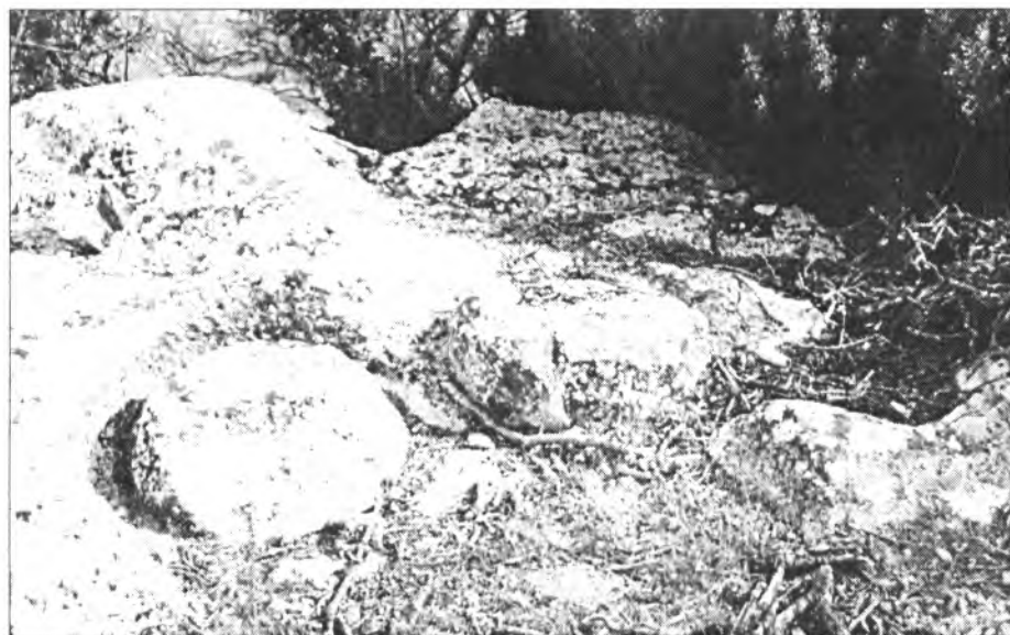
Lloc on antigament es tallaven les tapes per als sitjots a Son Ripoll