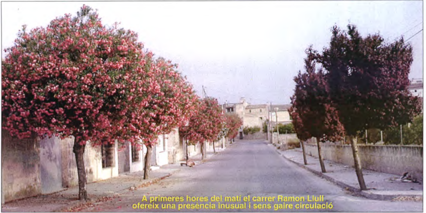
A primeres hores del matí el carrer Ramon Llull ofereix una presència inusual i sens gaire circulació