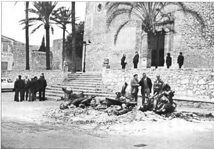
El foc ja s'havia acabat. Era el matí del dia de Sant Antoni de 1993

La religió cristiana en lloc d'enfrontar-se a unes creences tan arrelades, va aportar un dels sants principals: Sant Joan. Per això, arreu d'Europa, el solstici d'estiu se cele-