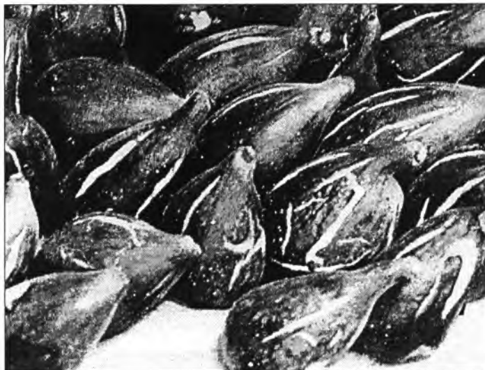
Les figues flor són en general un merjar exquisit

Ara bé: tot i que se n'hagin arrabassades moltes, es calcula que solament hi ha 10% de les que hi havia fins un poc passat mitjan segle vint, si n'han romases dretes o se n'hagin, diguem indultades, aquestes han estat les figueres flors i les albacons, les quals, per la seva qualitat i precocitat, tenen bona grossària,