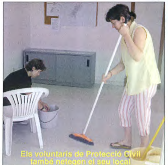
Els voluntaris de Protecció Civil també netegen el seu local