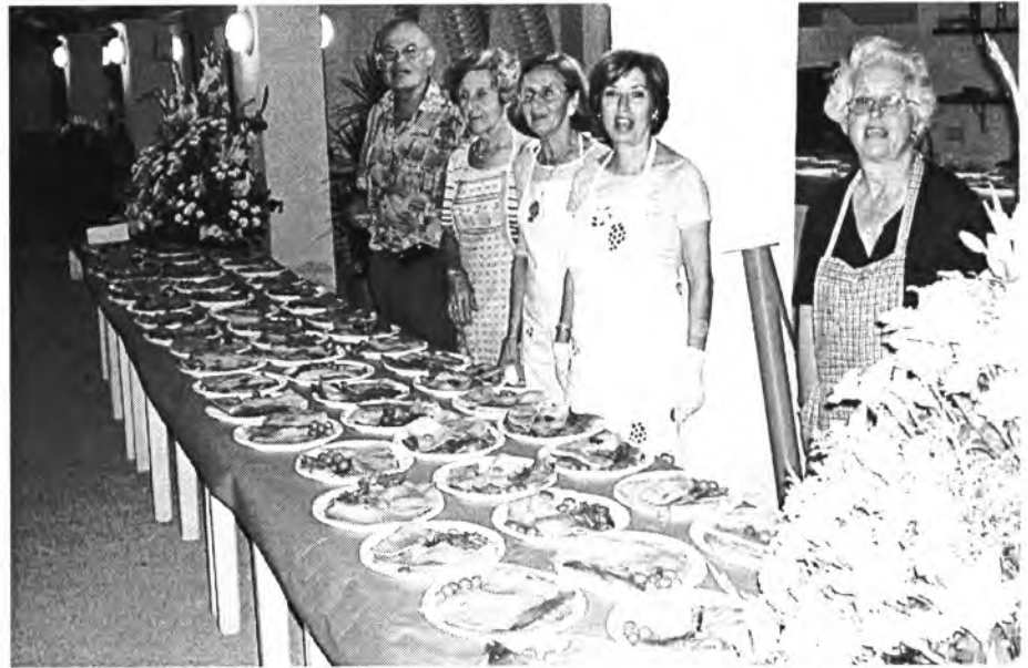
Bé es mereixen un reconeixement les persones (aquestes i altres) que amb tant d'esment prepararen el sopar a la fresca davant la piscina d'Es Dau

Agraïm l'ajuda i la solidaritat dels nombrosos grup de persones que ajudaren a preparar el sopar a la fresca del passat dia 18 de juny a la piscina del Dau. També volem donar les gràcies a les persones que hi participaren. D'aquesta manera heu ajudat a les despeses de la restauració de la teulada de la parròquia. En total foren més de 200 persones. Agraïm també la valuosa col·laboració de molts i moltes voluntaris i de la família de na Francisca Xorri per deixar-nos els locals. Finalment volem agrair la col·laboració de tantes persones que malgrat no pogueren ve-