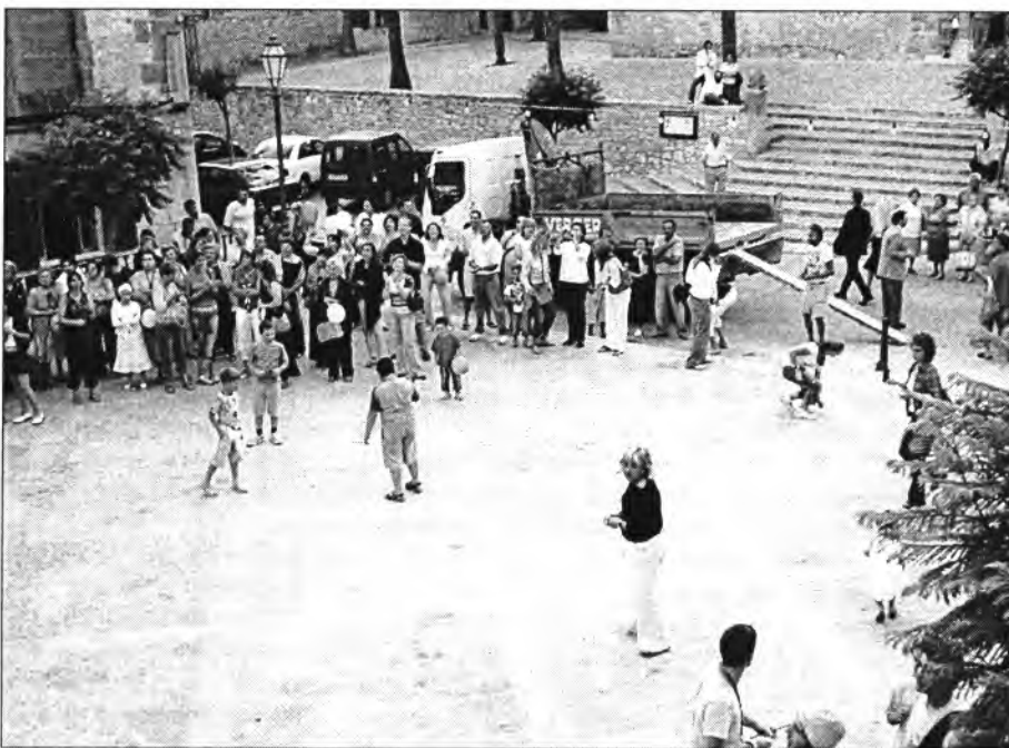
Un bon grapat de gent es va concentrar a plaça per rebre l'equip de minibàsquet després de la recepció oficial amb el batle

L'horabaixa de dia 11 les minis foren acollides a Plaça per un bon grapat de persones i també pel batle el qual les féu pujar i asseure a la sala d'actes on les felicità en nom de tot el poble per la seva extraordinària gesta esportiva. Se'ls recompensà amb una medalla individual i després sortiren a la balconada on rebren l'aplaudiment del públic allà congregat. I el vespre participaren a un sopar que en honor seu se les va tributar.