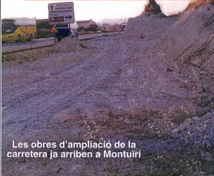
Les obres d'ampliació de la carretera ja arriben a Montuïri

Nº. 629 - ANY LIII - MONTUÏRI - JULIOL - 2005