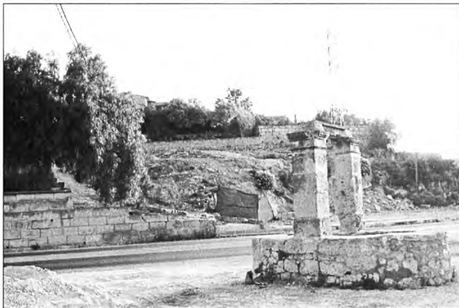
Així va quedar l'entrada de Sa Cova a conseqüència de les obres de la carretera. En primer terme, el Pou de Sa Cova, que es conservarà

Aquest mes passat s'han començat a eixernar els camins rurals del terme amb una màquina