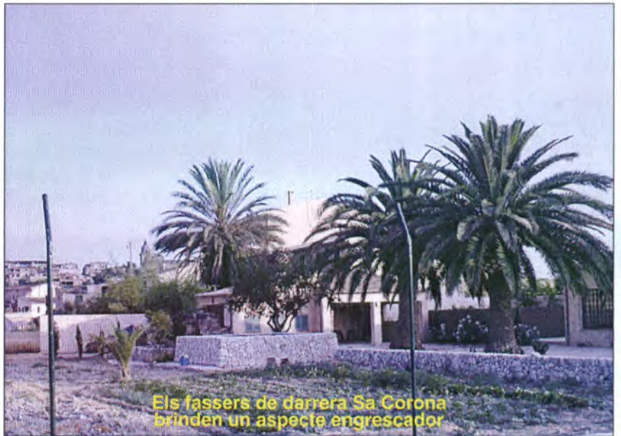
Els fassers de darrera Sa Corona brinden un aspecte engrescador