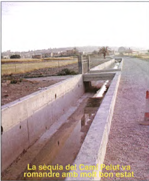
La sèquia del Camí Pelut va romandre amb molt bon estat