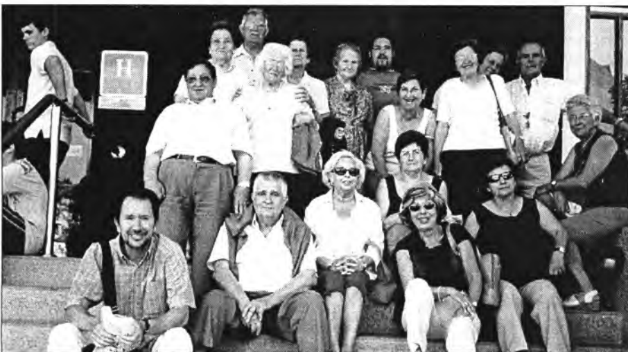
Vint montuïrers participaren a l'excursió que dia 8 de juny passat va organitzar s'Institut a Eivissa

Encara se senten veus que donen la culpa al departament de Patrimoni del Consell i al del Bisbat de no haver-se construït la rampa d'accés als graons. I d'aquesta manera els montuïrers impeditos per ara i per molt de temps no tendran accés als graons ni a l'església. I això que és una cosa nostra.