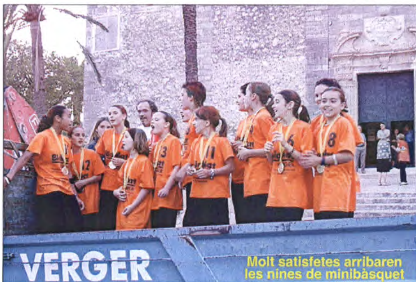
Molt satisfetes arribaren les nines de minibàsquet